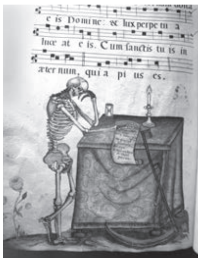
Ил. 3. Смерть у алтаря. Миниатюра из градуала. Германия. Ок. 1725 г. Москва. РГБ. Ф. 270, 16, № 4, с. XXXVI