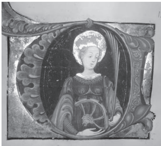
Ил. 7. Св. Екатерина. Историзованный инициал из хоровой книги. Ломбардия. Середина XV в. Москва. РГБ. Ф. 183, № 1678, № 19