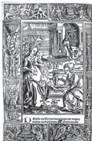
Ил. 2. Давид и Вирсавия. Гравюра из печатного часослова Пьера Реньо. Руан. Начало XVI в.