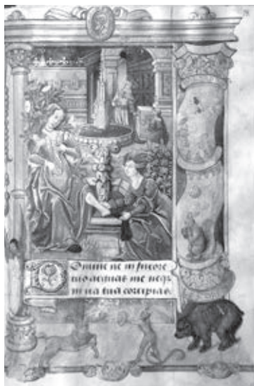
Ил. 1. Давид и Вирсавия. Миниатюра из часослова. Бургундия. Начало XVI в. Москва. РГБ. Ф. 183, № 1911, f. 74

На названных листах с коллажами среди прочих наклеены семь историзованных инициалов неизвестного монограммиста CZ, работавшего в конце XVI века. Ориентация на гравированные источники в его сюжетных композициях была очевидна с первого взгляда. Часть их также удалось найти: так, сцену борьбы архангела Михаила с сатаной монограммист скопировал