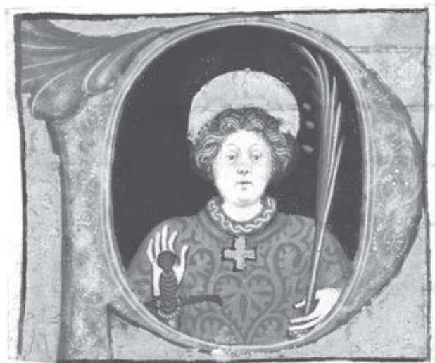
Ил. 8. Неизвестный святой. Историзованный инициал из хоровой книги. Ломбардия. Середина XV в. Филадельфия (США). Публичная библиотека. Lewis E M 29:4