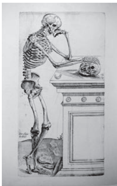
Ил. 4. Ян Стефан ван Калькар. Иллюстрация к «Анатомии» Андрея Везалия. Базель. 1543. С. 164

с гравюры нюрнбергского мастера начала XVI века Ханса Шпринггиле, «Богородица с Младенцем» – с гравюры Луки Лейденского 6 .