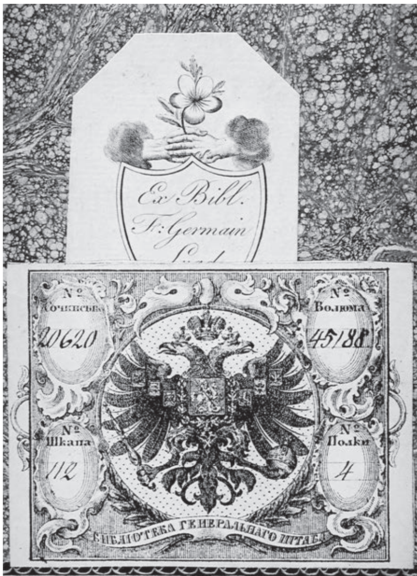
Ил. 9. Два экслибриса. Фламандский часослов. Брюгге. Третья четверть XV в. Москва. РГБ. Ф. 68, № 438