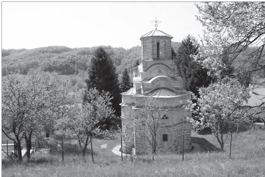
Ил. 5. Церковь Богородицы монастыря Наупара. Вторая половина XIV в.