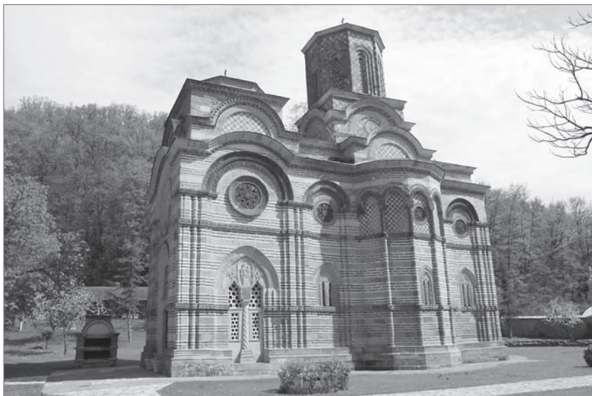
Ил. 6. Церковь Введения Богородицы монастыря (Каленич). Первая четверть XV в.