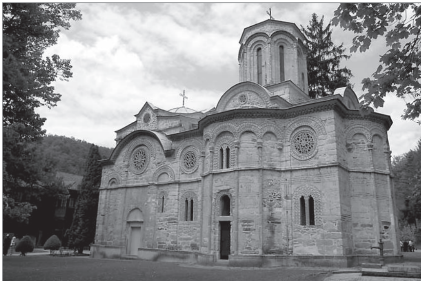
Ил. 3. Церковь Успения Богородицы монастыря Любостыня. Конец XIV в.