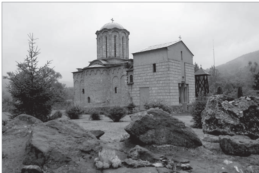
Ил. 8. Церковь Преображения монастыря Сысоевац. Последняя четверть XIV в.

наиболее полно моравский стиль проявляет себя в Лазарице и Раванице. Однако если Вулович и Ристич ставили эти памятники в начало ряда моравских построек, то, по мнению Ристича, им должен был предшествовать некий путь развития. Ристич категорически отрицает возможность влияния на моравское зодчество современной ему архитектуры Византии, Приморья и Запада. Точно так же, без сомнений и доказательств, он пытается узаконить ранние датировки некоторых моравских построек, предложенные предшественниками, особенно Стричевичем. По мнению Ристича, в течение длительного времени на архитектуру косовско-метохийских и македонских областей влияли афонские традиции, что привело к появлению там триконхов уже в 1320–30-е годы (Хрельев Пирг, Рджавац, церковь Свв. Архангелов в Кучевиште). Их он обозначает как «протоморавские» и считает прототипами вариантов позднейших моравских храмов (четырёхстолпный, однонефный и упрощенный). С точки зрения Ристича, нужно отказаться от термина «Моравская школа» и заменить его на три других, соответствующих предлагаемой им новой периодизации. Триконхи 1320–50-х годов, находящиеся не на моравских территориях, он предлагает называть «предморавскими». Затем выделяется группа «ранних моравских триконхов», находящихся на моравских территориях и относимых Ристичем к периоду между 1350 и 1389 годами. Наконец, архитектуру 1389–1459 годов он предлагает на-