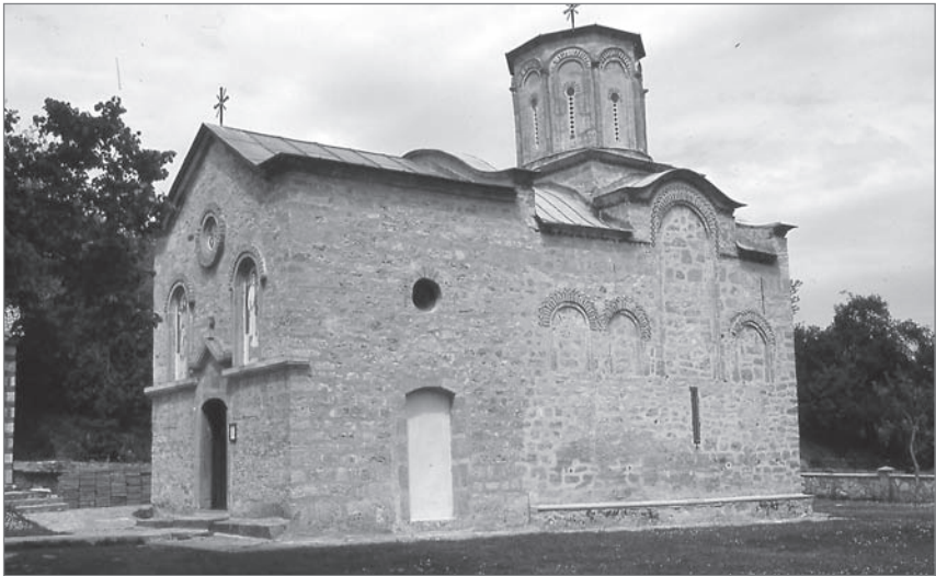
Ил. 10. Церковь Св. Стефана монастыря Копорин. Первая четверть XV в.