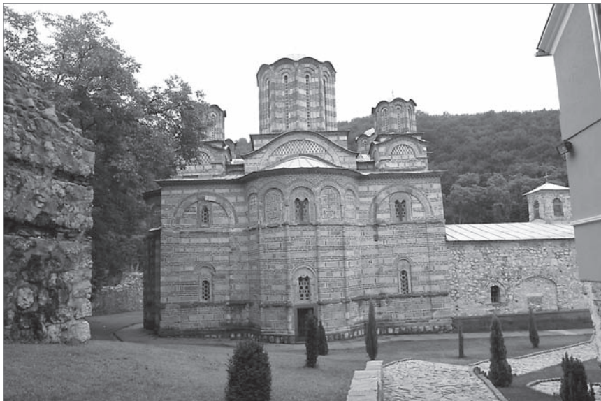
Ил. 1. Церковь Вознесения монастыря Раваница. Последняя четверть XIV в.