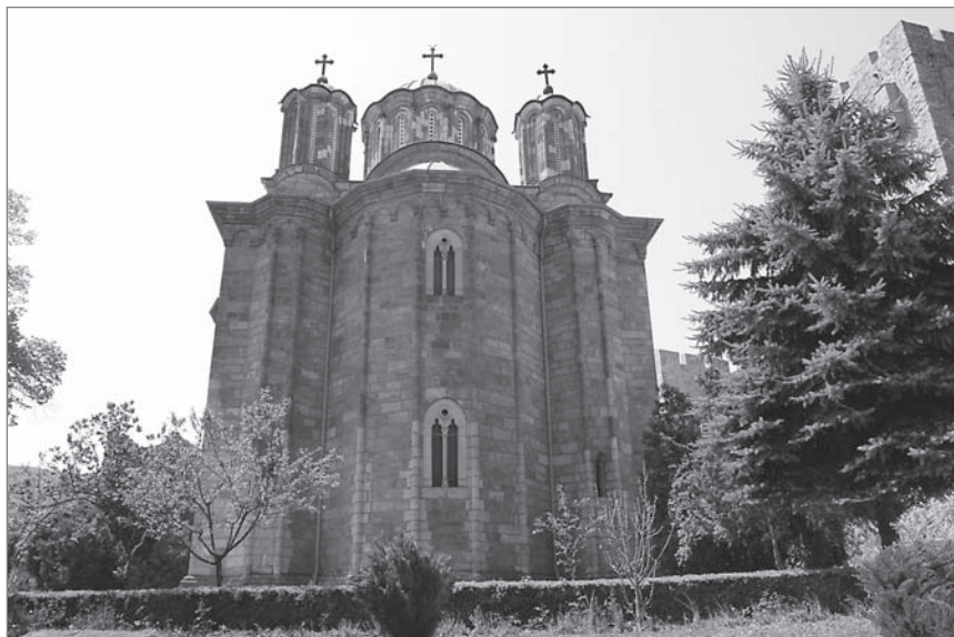
Ил. 4. Церковь Св. Троицы монастыря Ресавя (Манасия). Первая четверть XV в.