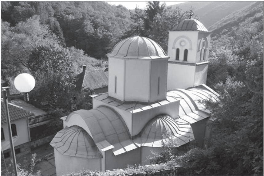
Ил. 9. Церковь Введения Богородицы монастыря Горняк. Последняя четверть XIV в.

зывать «позднеморавской» и рассматривать каждую область по отдельности. Таким образом, Ристич пересматривает терминологию, хронологию и саму структуру старой периодизации и классификации, разводя понятия «моравский период» и «моравские территории».