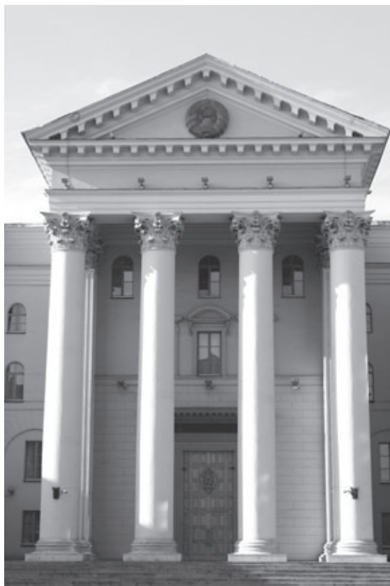
Ил. 8. Портик Административного здания на проспекте Сталина. Минск. Архитектор М.П. Парусников.

Вообще в основе пространственной композиции Проспекта – цикл своеобразных пропилеев. Два симметричных монументальных восьмизэтажных здания на пересечении Проспекта и улицы Янки Купалы, запроектированные М. Барццем, фланкируют переход от водно-зеленого диаметра к осевому развитию магистрали, а далее мотив пропилеев развивают симметричные монументальные жилые дома по проекту М. Парусникова и Г. Заборского, поставленные на торжественном «входе» в кульминационную часть главной улицы со стороны Центральной площади. (Ил. 9.)