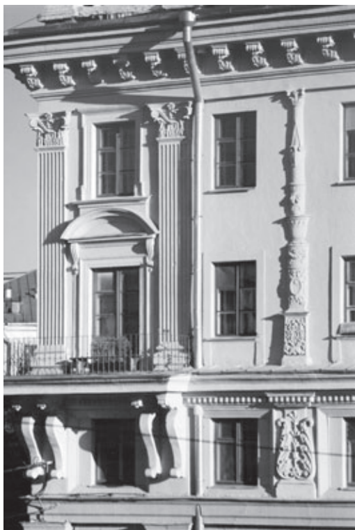
Ил. 9. Фрагмент жилой застройки на проспекте Сталина, Минск.