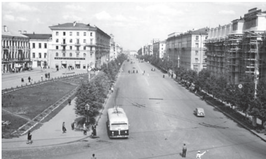
Илл. 6. Проспект Сталина в процессе реконструкции в начале 1950-х годов.

ально прочитывается из центра его первой очереди (примерно в районе ГУМа), где хорошо видна единая линия верхних отметок всей триумфальной процессии застройки, от площади Ленина до парка имени Янки Купалы. Этот блестяще примененный прием классицистического урбанизма сплотил архитектурную процессию Проспекта в визуальное целое.