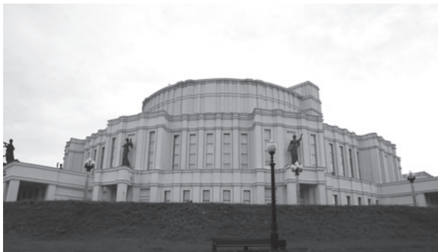
Ил. 2. Театр оперы и балета. Минск. Архитектор И.Г. Лангбард.

Сам мастер так и не смог перейти на позиции послевоенной декорации «сталинского ампира», с удивительной для того времени смелостью характеризуя ее как архитектуру «пустозвонных портиков и колоннад» 2 . Иосиф Лангбард покидал Минск как израненный лев. В записке начальнику управления по делам архитектуры при Совете министров БССР М. Осмоловскому он говорил с трагической резкостью: «Моя 20-летняя архитектурная деятельность в Беларуси, очевидно, должна прекратиться. Вы хорошо знаете, что это я делаю не по своей, а по Вашей воле. Но, оставляя в стороне личные причины этого дела, я, как уроженец Беларуси, отдавший ей лучшие годы моей жизни, считаю уместным высказать некоторые соображения об идеологической направленности послевоенной ее архитектуры» 3 .