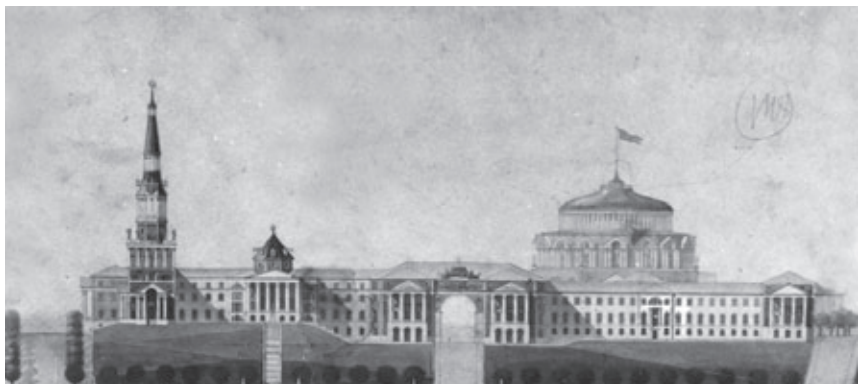
Ил. 4. Проектное предложение по реконструкции центральной площади в Минске. Архитектор И.Н. Соболев

В советском градостроительном искусстве последовательно реализовывался картезианско-классицистический принцип верховенства урбанистического плана над пульсирующим живым многообразием среды. Поэтому проектные конкурсы, демонстрирующие различные конкурирующие методы и образы, предшествующие реализации на месте, играли исключительную роль в советской архитектуре. Советские конкурсы 1940-х годов исполняли особую «шоу-миссию», зримо удостоверяя в будущем парадизе социализма. Воображаемая архитектура принимала на себя роль отсутствующей в советском обществе магии, замещая ею реальный минимальный жизненный комфорт.