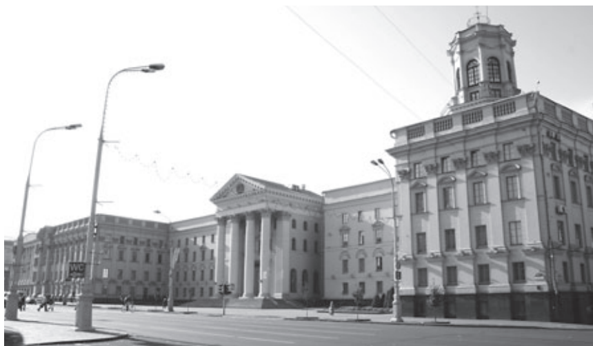
Ил. 7. Административное здание на проспекте Сталина. Минск. Архитектор М.П. Парусников.

Горизонталь и ось Проспекта в плане «разбиты» на систему кварталов-блоков, чередующихся с озелененными просветами. Сформировался характерный для классического урбанизма гармоничный «период» осевого пространственного развития, выразительность которому придают активные раскрытия в ландшафт. Весь ансамбль располагался между двумя площадями – Ленина и Победы, что также характерно для классических планировок. Амфитеатр площади Победы с обелиском завершил движение Проспекта.