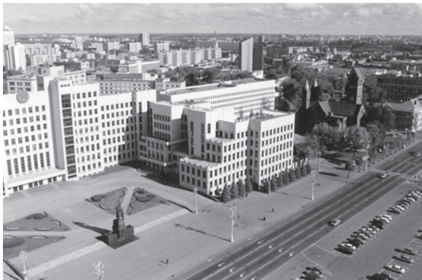
Ил. 1. Дом Правительства. Минск. Архитектор И.Г. Лангбард.

Сила урбанистического прозрения архитектора выразилась в создании взаимосвязанной композиции силуэта центра. Этому он подчинил пластику своей монументальной архитектуры, делая ее сдержанно-мощной. Дом правительства Лангбарда во многом предопределил характер монументальности послевоенного широкого Проспекта, став его началом. Создателям послевоенного Проспекта приходилось учитывать это видение формы города, одновременно споря с ним и пытаясь отвергнуть многомерную пространственность лангбардовского урбанизма.