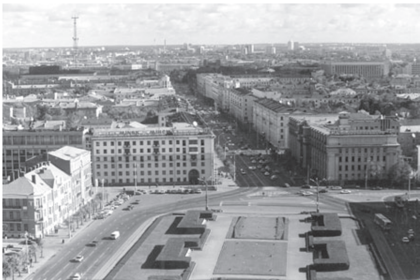
Ил. 10. Проспект Сталина—Ленина—Скорины—Независимости. Минск.

в которых «значительные излишества допущены при проектировании и строительстве жилых и общественных зданий». Борьба с архитектурными излишествами, помимо рационализации и удешевления строительства, стала символической деконструкцией Стиля и образа империи имени собственного .