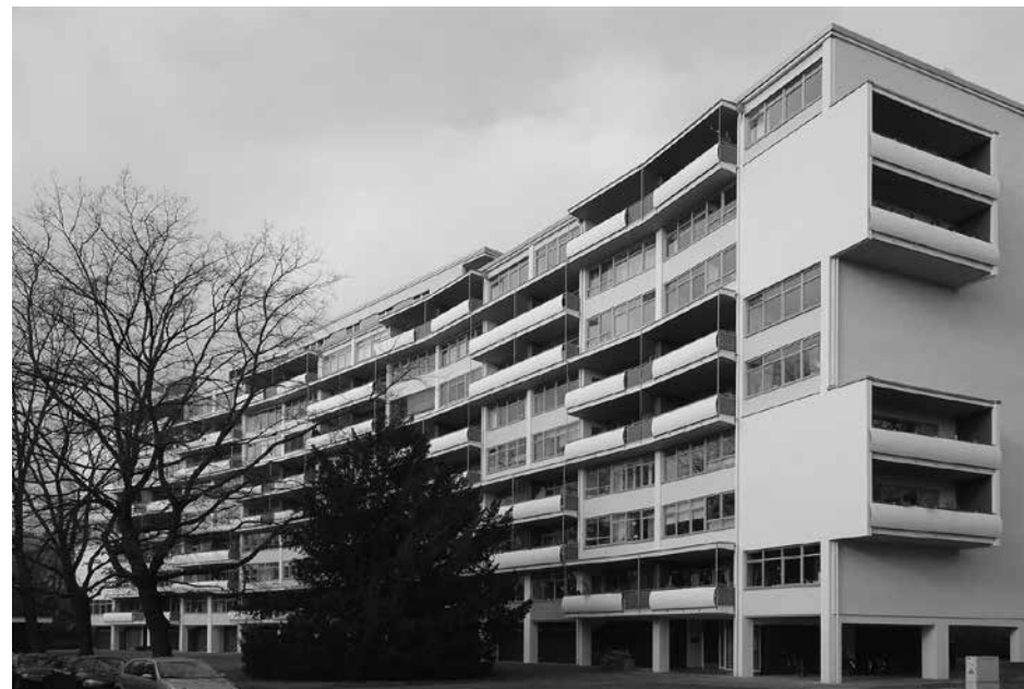
2. Вальтер Гропиус. Многоквартирный дом, построенный в рамках выставки Интербау , Берлин. 1957

свою цель в «оживлении» национальной памяти. Характерный пример романтических упований не на «корни», а на современные технологии — представленная в докладе Николая Малинина (Институт модернизма, Москва) «Оттепель на жару: как романтики 1960-х пытались победить климат (случай Алма-Аты)» история создания института «Казгорстройпроект» в Алма-Ате, завершеного в 1961 году. Одно из первых модернистских зданий города стало памятником как попытке игнорировать конкретные климатические условия, так и провалу этих усилий — это ли не восстание места против неумной бодрости стандартов и норм?