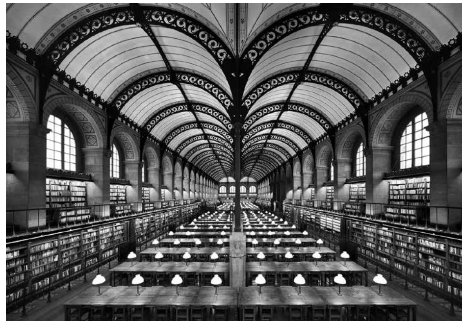
1. Анри Лабруст Библиотека Св. Женеьевы, Париж 1838–1850

Привычное противопоставление «современного» и «консервативного» искусства, «капиталистического» и «социалистического», «национального» и «глобального», или же «западного» и «восточного» всегда чревато неизбежным упрощением реальности и утратой