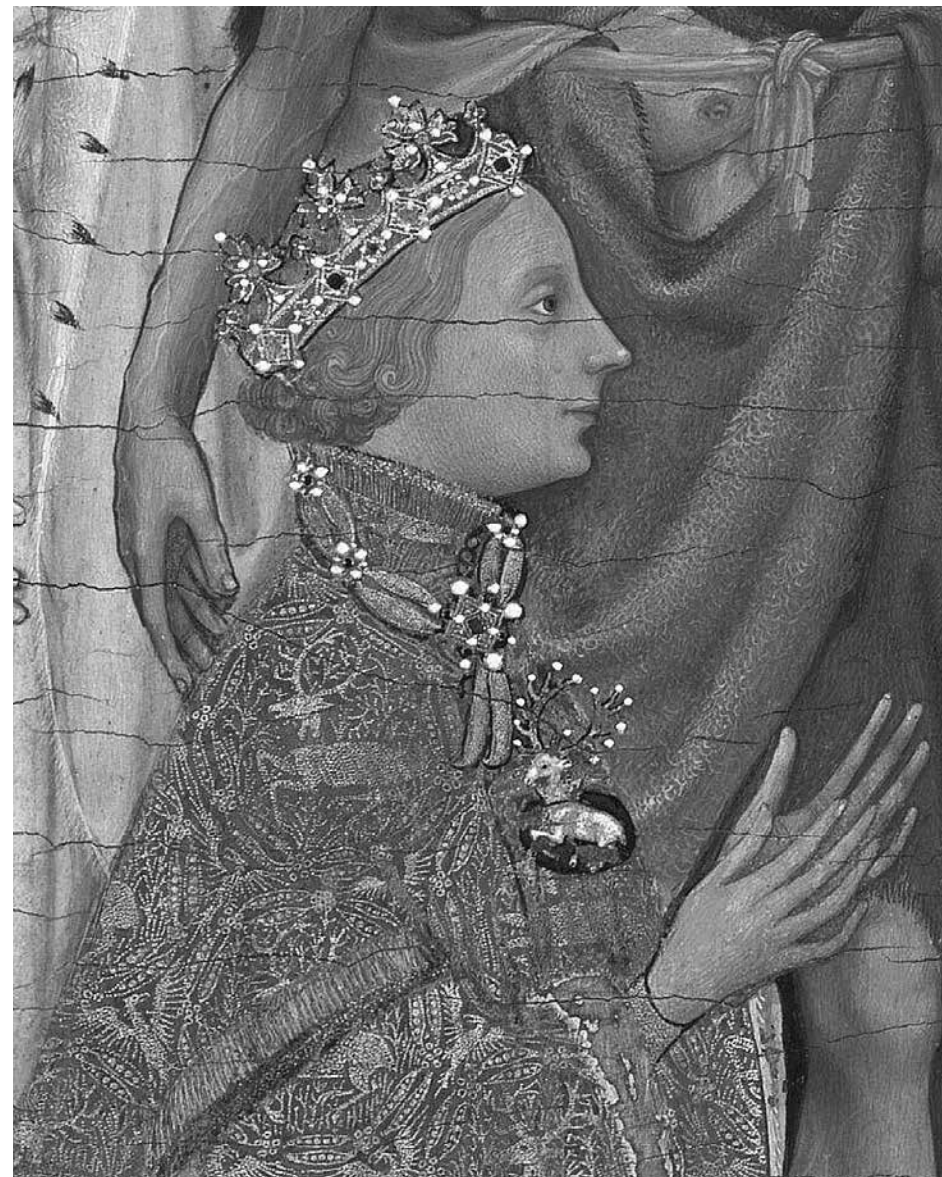
5. Неизвестный художник. Уилтонский диптих. Фрагмент