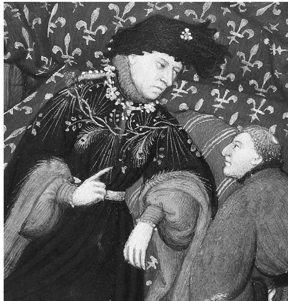
3. Неизвестный художник. Карл VI в цепи ордена Стручка дрока Фрагмент миниатюры из рукописи «Диалог между Пьером Сальмоном и королем Франции Карлом VI. — Различные письма Пьера Сальмона, секретаря короля, Карлу VI, Иоанну Бесстрашному, герцогу Бургундии и т.д., с ответами». Около 1413–1415 Библиотека Женевы, Ms. fr. 165, f. 4r

Одна из тенденций в изучении личности Ричарда II и его роли в Столетней войне заключается в приписывании английскому королю неких черт характера, которые и определяли его действия. Например, улучшение отношений между Англией и Францией в этот период