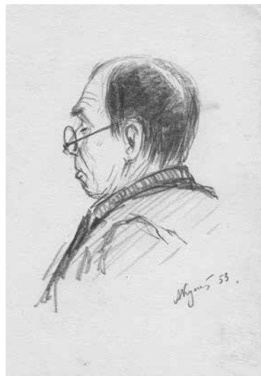
8–11. Рисунки Н. А. Дмитриевой — возможно, сотрудники Института истории искусств