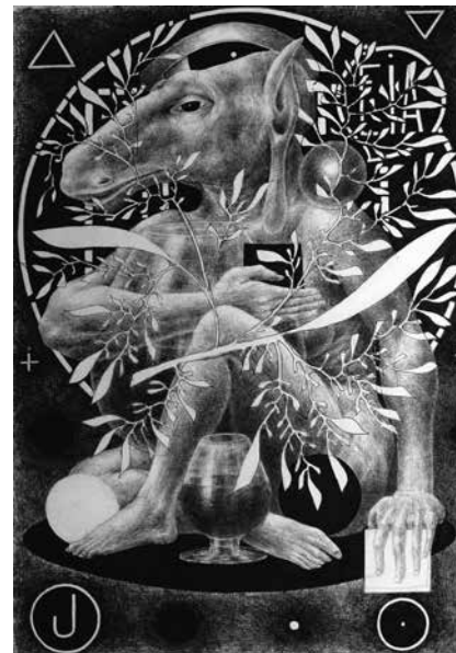
1. Д. А. Пригов. Портрет Жака Деррида . 2004. Бумага, карандаш, шариковая ручка, гелевая ручка, перьевая ручка, акварель, гуашь. 29,5 × 21. МОММА, Москва © Надежда Бурова и Фонд Дмитрия Пригова