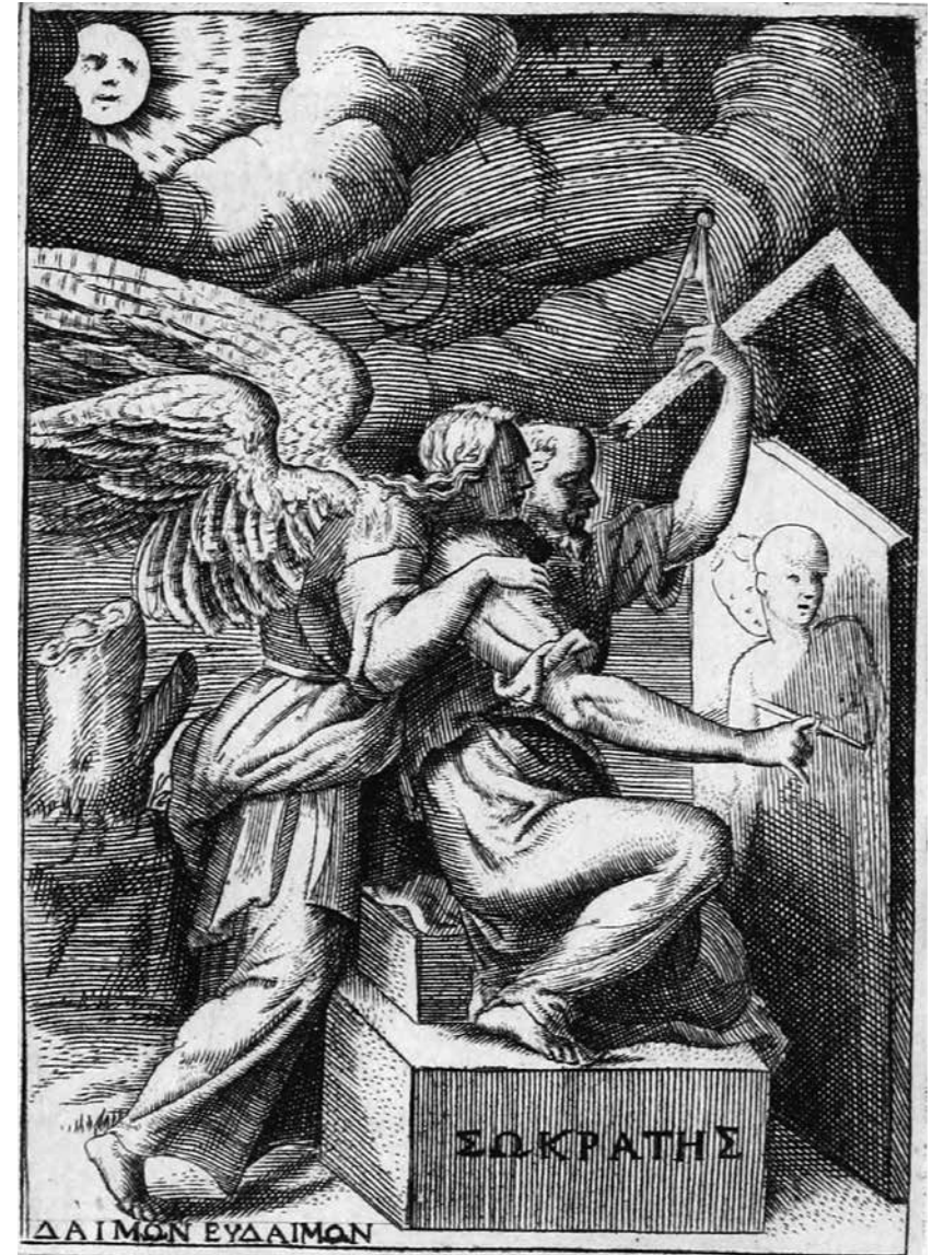
3. Сократ и его демон. Гравюра из кн.: Achille Bocchi, Symbolicarum quaestionum de universo genere . Bologna, 1555