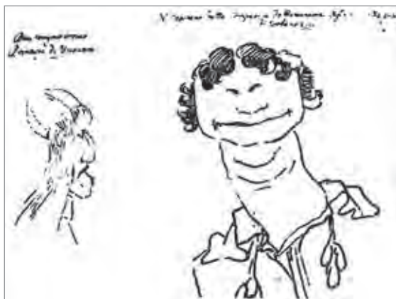
Ил. 9. Лоренцо Бернини. Карикатура на капитана папской гвардии. Бумага, перо, коричневые чернила. Национальная галерея античного искусства. Рим