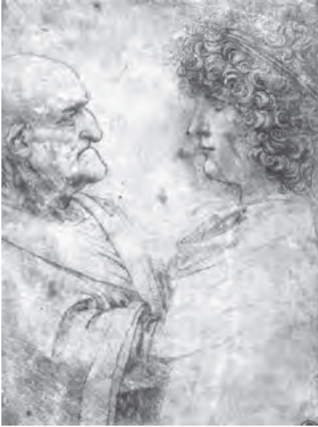
Ил. 3. Леонардо да Винчи. Старый и молодой. Ок. 1495 г. Галерея Уффици. Флоренция

новления закона эволюции вида, а в поиске основополагающих принципов, того, что Гёте назвал “первоначальным замыслом”». 15