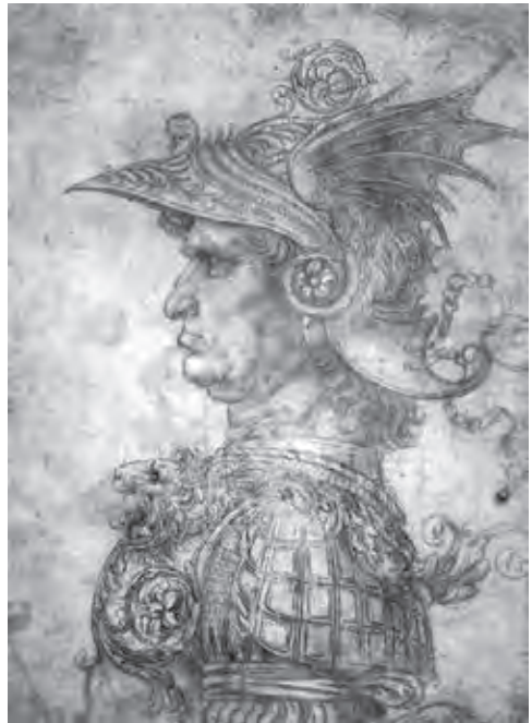
Ил. 4. Леонардо да Винчи. Старый воин. 1472. Металлический карандаш на подготовленной бумаге. 28,5x20,7. Британский музей. Лондон

Анализируя мнемонические опыты Леонардо с перестановкой и рекомбинацией лиц, Гомбрих сравнивает этот метод с работой бессознательного, в котором важную роль играют память и воображение. Мнемонические практики Леонардо Гомбрих сравнивает с принципом «контролируемой регрессии» со стороны творческого эго. Многие гротески – результат произвольных совмещений, трансформаций и