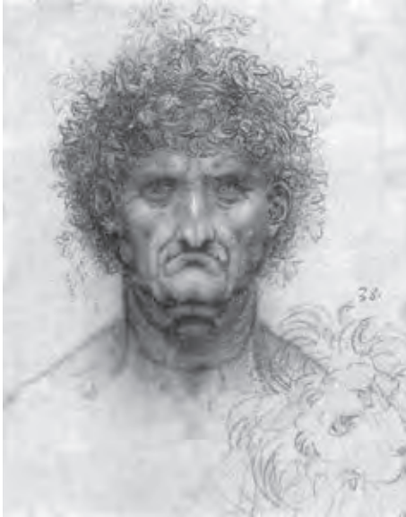
Ил. 1. Леонардо да Винчи. Голова человека и лев. 1503–1505. Красный и белый мел на розовой окрашенной бумаге. 18,3х13,6. Виндзорский замок

формы какого-либо члена человека, первого зверя среди животных , буду я соблюдать это правило, делая четыре изображения каждого члена с четырех сторон» (W. Ap. A. I v) 13 .