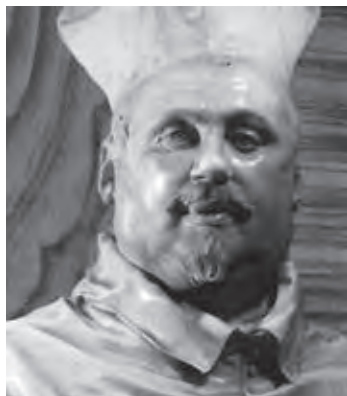
Ил. 8. Лоренцо Бернини. Бюст кардинала Сципиона Боргезе. 1632. Мрамор. Галерея Боргезе. Рим

Примером карикатурного пасквиля можно считать шарж Бернини на папу Римского Иннокентия XI (1676) из Музея изобразительных искусств Лейпцига. (Ил. 7.) Лаконичное гротескное изображение Иннокентия XI создано Бернини в возрасте 78 лет и явилось результатом сложных отношений художника к кардиналом, который пользовался дурной славой и враждебно относился к искусству. Иннокентий XI,