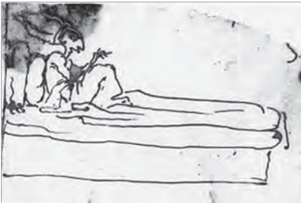
Ил. 7. Лоренцо Бернини. Карикатура на папу Иннокентия XI. 1676. Бумага, перо, коричневые чернила. 11,4x18,2. Музей изобразительных искусств. Лейпциг

тера, свойственные ему настроения и состояния. Вслед за братьями Карраччи к использованию гротескных рисунков при наблюдении за двигающейся натурой обратился Л. Бернини. Современники высоко ценили его острый сатирический ум, который он демонстрировал и как автор театральных постановок. Мотивы, по которым Бернини обращается к карикатуре, получают новые импульсы. Важную роль, наряду с