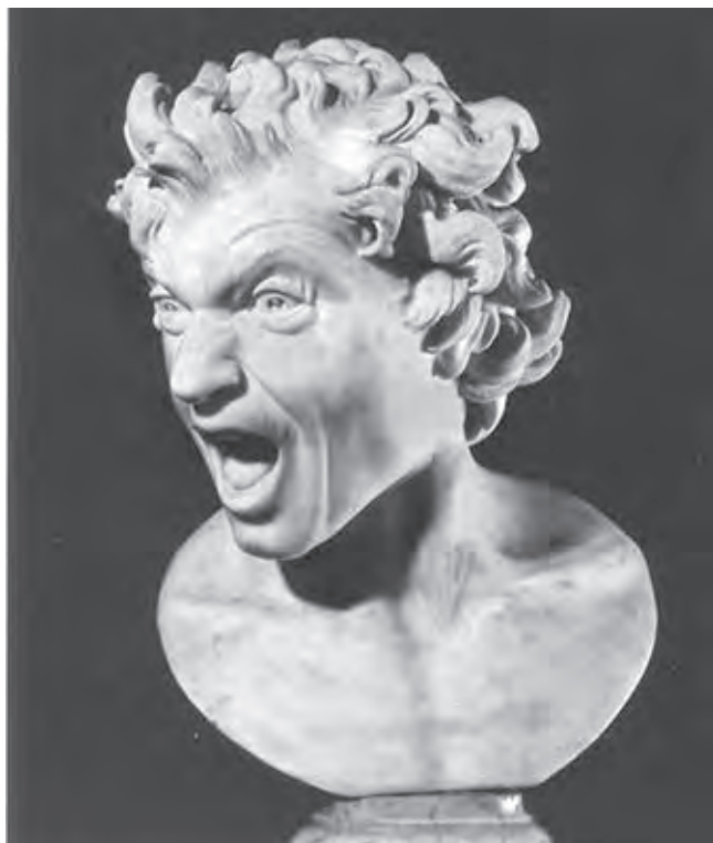
Ил. 11. Лоренцо Бернини. Anima Dannato . 1619. Мрамор. Палаццо Мональдески. Рим

хоаналитический аспект проблемы «физиогномического сходства» в контексте терминов восприятия. Наряду с методологическим пересмотром концепции бессознательного Фрейда Гомбрих в 1950–60-е годы привлекает опыт культурной антропологии К. Леви-Стросса и исследования в области неозолуционизма К. Лоренца, данные гештальт-психологии. В результате применения смежного инструментария к изучению смеховых жанров ученый приходит к выводу, что базовый схематизм гротескных образов разных культур можно рассматривать как первичный уровень обозначения реальности, который направлен на структурную организацию чувственного опыта и обращен к сфере бессознательного. Метафорические трансформации в гротесках и карикатуре сопоставимы с функциями ритуальных масок и тотемных образов: «Физиогномическое сходство является результатом слияний и осознания множественных факторов... Это основано на так называемом “общем впечатлении”... Попытка выявить в облике человека