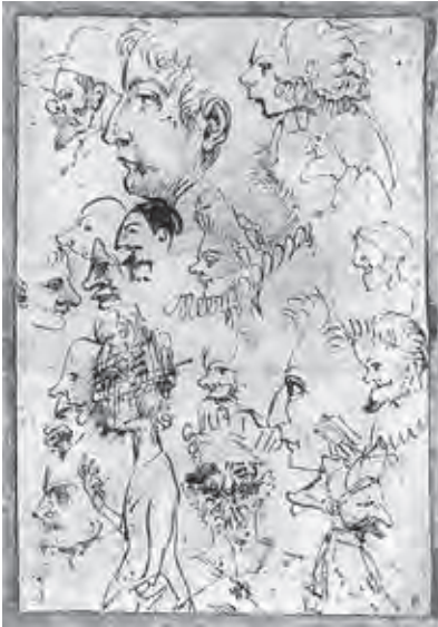
Ил. 6. Аннибале Карраччи. Серия карикатурных профилей. 1595. Перо, серо-коричневые чернила, бумага. 19,4x13,5. Британский музей. Лондон

В «Жизнеописаниях художников Болоньи» (1678) Карло Чезаре Мальвазия (1616–1693) 25 указывает на то, что созданный ими тип « trattini carichi » стал результатом наблюдений за жизнью толпы во время прогулок по городу. В «Серии карикатурных профилей» (1595) Аннибале Карраччи из Британского музея наглядно представлен метод его работы: плоскость листа покрыта небольшими беглыми набросками голов, некоторые из них – карикатурные шаржи реальных людей, другие похожи на вымышленные комические персонажи. (Ил. 6.)