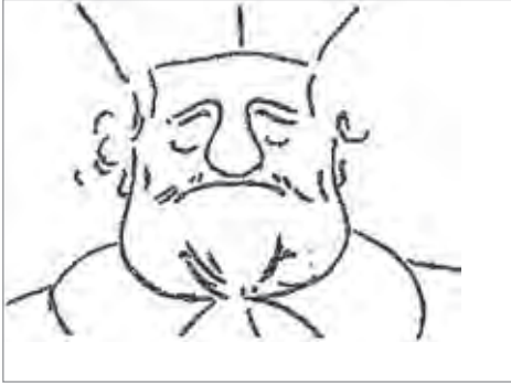
Ил. 10. Лоренцо Бернини. Карикатура на кардинала Сципиона Боргезе. 1632. Бумага, перо, коричневые чернила. 27,2x20. Апостолическая библиотека. Ватикан

тяготевший к уединению, изображен возлежащим на постели, которая словно благословляет его ипохондрию. Пример другого типа гротескных образов, имеющих форму шутки, а не сатирического пасквиля, являются карикатуры «Кардинал Сципион Боргезе» из Апостолической библиотеки Ватикана (ил. 10) и «Капитан папской гвардии» (ил. 9) из Национальной галереи античного искусства в Риме.