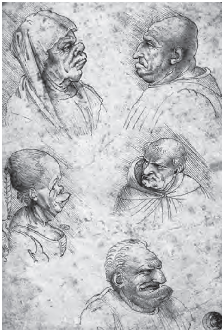
Ил. 2. Леонардо да Винчи. Гротескные головы. Ок. 1490 г. Бумага, перо, чернила. Галерея Академии. Флоренция

выявить базовую структуру, которую можно индивидуализировать. «Далекий от мысли, что он рисует “мужчину-льва” или “мужчину-лошадь”, Леонардо демонстрировал сущностное сходство способов проявления эмоций у позвоночных. В этих наблюдениях есть определенное совпадение с идеями Ч. Дарвина, но цель Леонардо состояла не в уста-