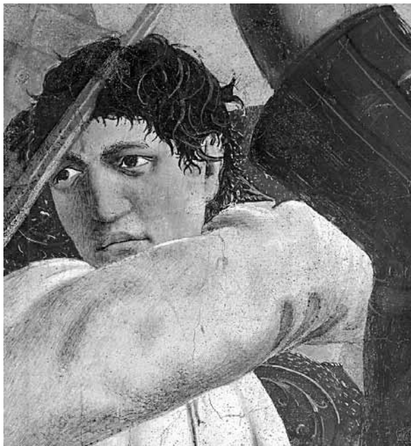
Пьеро делла Франческа. Битва Ираклия с Хозроем. Фрагмент фрески капеллы Баччи в церкви Святого Франциска в Ареццо

В подземелье, под основанием ее, кони двигались по кругу и владели квадриги, чтобы сотрясать башню и издавать грохот, сравнимый с раскатами грома. Передав царство своему сыну, нечестивец восседал в том святилище. Он поместил рядом с собою крест Господень и приказывал, чтобы все величали его богом. Как можно прочесть в «Митрале» 7 , Хозрой сидел на троне как Бог-Отец, держа в правой руке Древо креста по подобию Бога-Сына, и в левой руке петуха – по подобию Святого Духа. Себя же царь приказывал называть Отцом. В то время император Ираклий собрал несметное войско и выступил против сына Хозроя, намереваясь сразиться с ним на Дунае. Оба полководца договорились сойтись в поединке на мосту, чтобы тот, кто окажется победителем, получил власть без ущерба для обеих войск. Было решено, что всякий, кто попытается помочь своему полководцу, подвергнется казни: ему отсекут руки и ноги, после чего утопят в реке. И вот, Ираклий полностью предался Богу и со всем возможным благочестием препоручил себя Святому кресту. Полководцы долго бились, и Господь даровал победу Ираклию. Так он подчинил своей власти войско про-