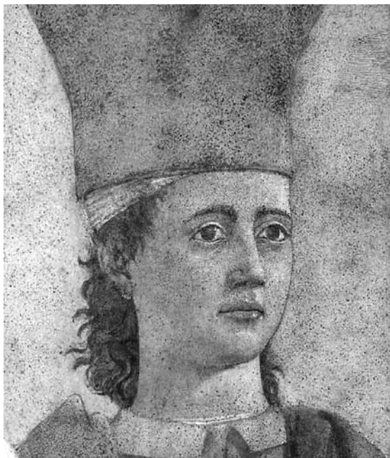
Пьеро делла Франческа. Император Ираклий возвращает Святой крест в Иерусалим. Фрагмент фрески капеллы Баччи в церкви Святого Франциска в Ареццо

В «Хрониках» о деяниях Ираклия рассказывается иначе. Повествуют, что, когда Хозрой, завоевав все царства, захватил в Иерусалиме патриарха Захарию и Древо креста, Ираклий пожелал заключить с ним мир. Но Хозрой поклялся, что мир с ромеями не будет заключен до той поры, пока те не отрекутся от Распятого Бога и не поклонятся Солнцу. Тогда Ираклий, возревновав, ополчился и двинул войско против персов. Он разгромил противника во многих битвах и обратил Хозроя в бегство, заставив отступить вплоть до Ктесифона. Там Хозрой заболел дизентерией и короновал на царство своего сына Медаса. Узнав об этом, его перворожденный сын Сироис заключил союз с Ираклием и, схватив отца со свитой, заковал его в цепи. Он насытил царя хлебом страданий и напоил водою скорбей, после чего приказал убить, забросав стрелами. Затем Сироис возвратил Ираклию пленных вместе с патриархом Захарией и Древом креста, император же перенес драгоценное Древо креста в Иерусалим и, позднее, отправил его в Константинополь. Так написано во многих «Хрониках». Как указывает «Трехчастная история» 8 , Сивилла, жившая среди язычников, так ска-