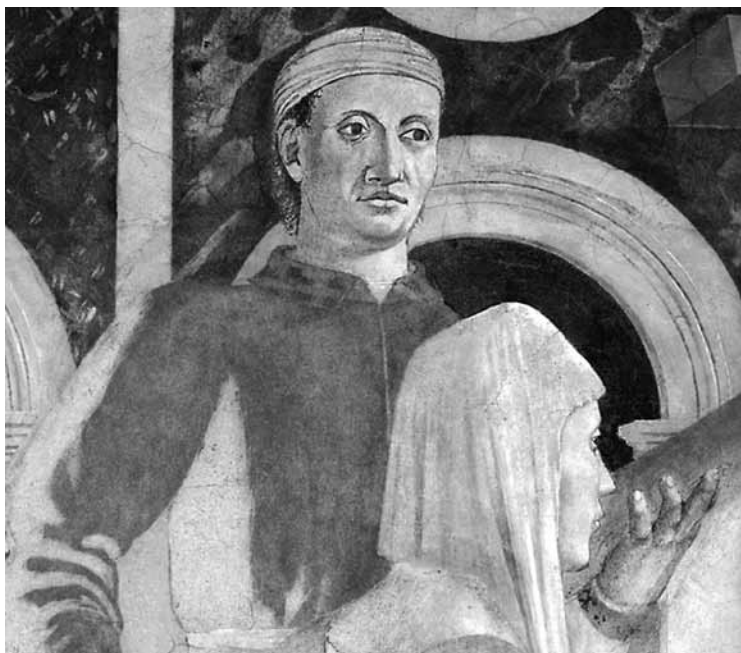
Пьеро делла Франческа. Испытание креста. Фрагмент фрески капеллы Баччи в церкви Святого Франциска в Ареццо

В сцене сна Константина, также расположенной в нижнем регистре на восточной стене, Пьеро делла Франческа блестяще справился с задачей изображения темноты, озаренной ирреальным мистическим светом. Вазари анализирует особенности этой сцены: «Но превыше всего проявились его талант и искусство в том, как он написал ночь и ангела в ракурсе, который спускается головой вниз, неся знамение победы Константину, спящему в шатре под охраной слуги и нескольких вооруженных воинов, скрытых ночной тьмой, и освещает своим сиянием и шатер, и воинов, и все околности с величайшим чувством меры» 10 .