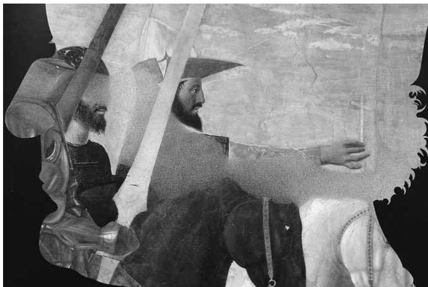
Пьеро делла Франческа. Император Константин. Фрагмент фрески капеллы Баччи в церкви Святого Франциска в Ареццо

свечу. «Константин, обрадованный и уверенный в победе, запечатлел на челе знак Креста, который увидел в небе, придал воинским значкам форму Креста и взял в десницу золотой Крест. После чего император обратился с молитвой ко Господу, да не позволит Он, чтобы десница, вооруженная спасительным Крестом, обагрила и запятнала себя кровью Римских граждан, но чтобы Господь даровал ему бескровную победу над тираном», – сообщает Иаков Ворогинский.