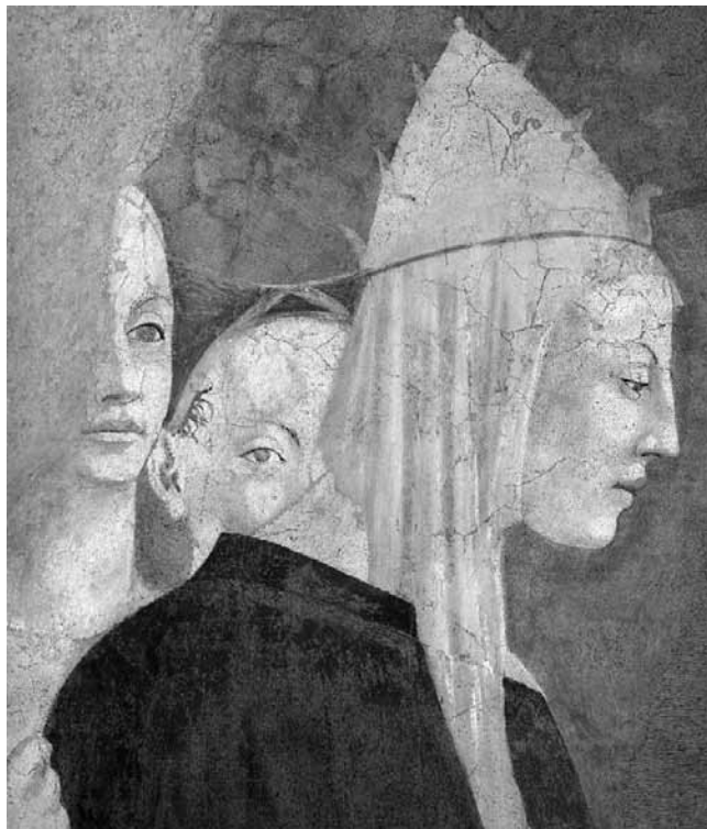
Пьеро делла Франческа. Императрица Елена. Фрагмент фрески капеллы Баччи в церкви Святого Франциска в Ареццо

рые он принял и передал царице. Она же, опустившись на колена и склонив голову, с великим благоговением почтила их. Часть креста Елена отвезла сыну, другую часть, заключив в серебряный реликварий, оставила в Иерусалиме. Она также передала сыну те гвозди, которыми пригвождено было тело Господне. Как сообщает Евсевий Кесарийский, Константин укрепил один из них на узде, которой пользовался, идя в битву, другой же поместил на своем шлеме. Некоторые, в том числе Григорий Турский, утверждают, что в теле Господнем было четыре гвоздя, из которых два Елена поместила в принадлежавшую императору узду. Один из гвоздей находился в статуе Константина, которая возвышалась над Римом, и еще один Елена бросила в Адриатическое море, дабы его пучины боле не страшили мореплавателей. Царица постановила ежегодно торжественно отмечать