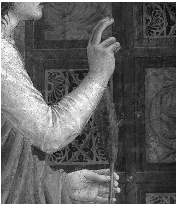
Пьеро делла Франческа. Благовещение. Фрагмент фрески капеллы Баччи в церкви Святого Франциска в Ареццо

поклонилась ему». Идеальные архитектурные фоны, волнистая линия холмов и глубокая синева неба с мягкими серыми облаками как бы создают единое пространство, в котором пребывают величественные и спокойные фигуры героев обеих фресок. Среди построек града Иерусалима, изображенного на фреске со святой Еленой, можно угадать очертания церквей средневекового Ареццо.