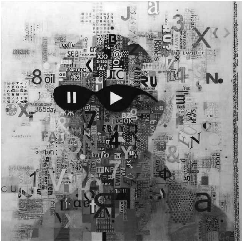
Ил. 1. Л. Баласанова, С. Колеватых. Человек Облако. 2010. Холст, смешанная техника. 110x110

сознание в форме игры, то мозг может «сломаться». Во всяком случае, сейчас уже хочется в этой игре оставаться, так как наступает странный промежуточный момент перед возникновением чего-то иного.