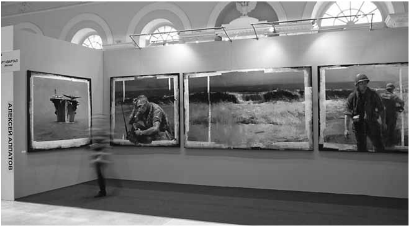
Ил. 5. А. Алпатов. Военно-морской пейзаж. Триптих. Холст, смешанная техника. Проект Галереи АртКвартал, куратор А. Шаров. 2011

Его картина убедительно свидетельствует о проблемах войны и мира, о хрупкости человека перед лицом стихии разрушения стабильности, и, пожалуй, главное в ней – она не просто подталкивает к размышлению, но провоцирует явный диалог автора со зрителем, когда посетитель сможет увидеть именно то, что он хочет видеть. Если зритель в постмодернизме был устранен от дискуссии, ставился перед фактом создания произведения искусства, то в пост-постмодернизме произведение и художник соответственно борются за аудиторию из зрителей и критиков, открывая им личностный взгляд на творчество. В картине А. Алпатова выявлен парадокс: она о войне, но вместе с тем она выражает идею гуманизма, так как главное в ней – Человек, который может стать как творцом мира, так и творцом войны, и часто только от его решения зависит, мир будет или война – все в его власти.