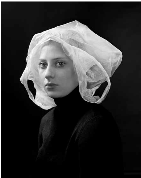
Илл. 3. Х. Керстенс. Refuse veil / Пакет для мусора. 2008. Фотография. С-print. 62,5x50

циклов опосредованности, и, соответственно, к реальности (априорной подлинности) уже не имеют отношения. Симулякр по существу этого понятия закладывает основы мотивации на манипуляцию образами и смыслами, заимствованными из настоящего или прошлого, превращая их в «правдоподобное подобие» 14 , наделяя гротеском, микшированным знаком и новыми (другими) кодами для прочтения культурного текста, доступными декодированию новому (другому) субъекту. То есть симулякр задает технологию производства новых знаков в искусстве. В этих признаках – характерная общность двух понятий.