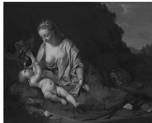
7. Ван дер Верф. Отдых на пути в Египет . 1702 Дерево, масло. 38,5 × 46,6 Старая пинакотекa, Мюнхен, inv. 251