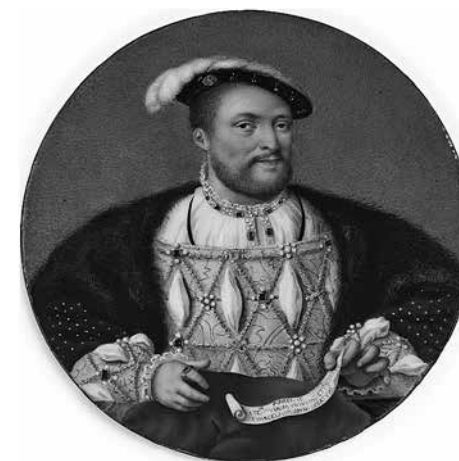
6. Иоганн Генрих Хуртер. Генрих VIII 1788. Медь, эмаль. Диаметр 10,6 Собрание Т. и С. Подстаницких, Москва

после высказанного императрицей недовольства, а миниатюра уже была сделана и осталась у художника?