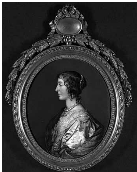
2. Иоганн Генрих Хуртер. Генриетта-Мария, королева Англии . 1787 Медь, эмаль. 15,2 × 12,7 Государственный Эрмитаж, инв. № ОРМ-261.

в Мюнхен) [10, p. 14] 11 . В контексте «русского» заказа принципиально, что художник выражает надежду, что в означенной подписке будет участвовать князь Орлов, который весьма одобрил его план. Кроме того, он сообщает, что у князя Орлова уже есть эмаль его работы, и даже приводит ее описание: это копия с очень красивого женского портрета Ван Дейка из галереи в Дюссельдорфе [9, p. 15]. Примечательно, что в эрмитажной коллекции ранее находился «Портрет женщины в черном шелковом платье», по Ван Дейку, из картинной галереи Дюссельдорфа, с подписью J. Hurter 1775 , выданный в Госторг в 1929 году 12 . Таким обра-