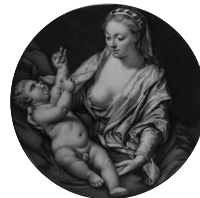
8. Иоганн Генрих Хуртер Мадонна с младенцем 1776. Медь, эмаль. Диаметр 9 Государственный Эрмитаж, инв. № ОРМ-673

бенно, «Портрет художника» (ранее «Автопортрет Каспара Нетшера»). Среди упомянутых в статье работ есть вариант, когда Хуртер значительно изменяет композицию оригинала, очевидно, приспособляя ее к размеру и форме миниатюры. Это «Мадонна с младенцем», из коллекции Эрмитажа, не вошедшая в означенные квитанции (см. примеч. 11). На картине Ван дер Верфа мы видим Мадонну и св. Иосифа, протягивающего младенцу веточку (полотно прямоугольное, вытянутое по горизонтали). На миниатюре в форме тондо остались только Мадонна с младенцем. (Ил. 7–8.) Несмотря на то что подобная вольная интерпретация оригинала свойственна в целом всей репродукционной миниатюре на эмали того времени, здесь многое противоречит программе Хуртера «сохранить знаменитые картины для потомков», заявленной в его «Проспекте» 23 . Впрочем, причины недовольства Екатерины II могли быть самыми разными. Остается много вопросов. Безусловно, для объективного ответа на них нужно знать все 40 миниатюр, предназначенных для августейшей заказчицы.