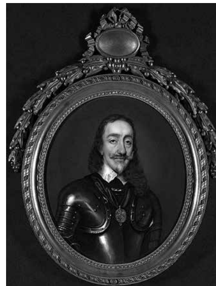
3. Иоганн Генрих Хуртер. Карл I, король Англии . 1787. Медь, эмаль. 15,2 × 13,5 Государственный Эрмитаж, инв. № ОРМ-260.