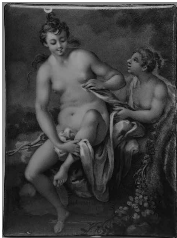
1. Иоганн Генрих Хуртер. Купание Дианы . 1776. Медь, эмаль. 10,4 × 7,8 Государственный Эрмитаж, инв. № ОРм-798

ил. 1) 8 с надписью на контрэмали: Destinez pour a Majestet. L'Imperatrice de Russie Catherine. II. par son tres de vouez et Soumis. Serviteur J. H. Hurter. Fecit. 1776 9 («Для Ее Величества Императрицы России Екатерины II ее преданнейший и покорнейший слуга И. Г. Хуртер. 1776»). Эмаль изготовлена и сопровождается почитательной надписью в год издания упомянутого выше «Проспекта»; очевидно, это рекламный образец продукции художника, свидетельствующий о чаяниях Хуртера получить