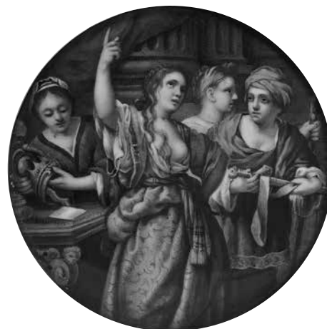
5. Иоганн Генрих Хуртер. Семирамида 1777. Медь, эмаль. Диаметр 11 Государственный Эрмитаж, инв. № ОРМ-2779.