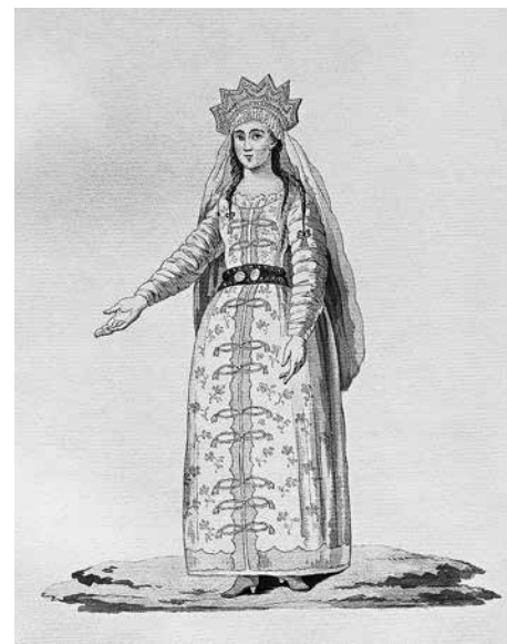
18. Иван Иванов по проекту Алексея Оленина. Княгиня Ольга. Бумага, акварель. 27,3 × 21,7. Ил. из альбома: Choix d'anciens costumes russes d'après les Monuments les plus authentiques . Л. 22.

двум гравированным изображениям [76, p. 103, pl. 36; 83, pl. CXXXVI]. (Ил. 22–23.) Ручки редкой формы в виде женских голов и довольно хорошо-видимая роспись позволяют узнать его, несмотря на известную вольность художника в обращении с источником, получившим в картине куда более правильный и идеальный с неоклассической точки зрения вид. (Ил. 24.) Роспись сосуда, подробно описанная в каталоге этрусских ваз Пассери, имеет весьма подходящий к месту сюжет: юная женщина в хитоне держит в руках ларнакс — небольшой саркофаг в виде закрытого ящика с погребальной золой, в то время как другая, коленопреклоненная, протягивает к ней руки [83, pl. CXXV–CXXXVI]. Ответ на вопрос, знал ли художник изображение этрусского сосуда,