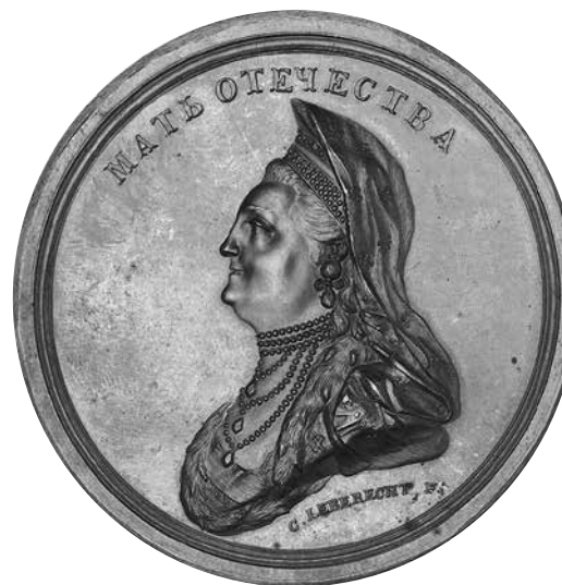
10. Карл Леберехт. Медаль в честь императрицы Екатерины II. 1779 Лицевая сторона. Медь, чеканка. Диаметр 5,5. Государственный Эрмитаж