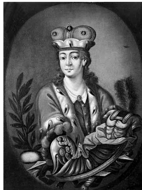
25. Неизвестный художник. Портрет актера Федора Волкова (?) Россия, вторая половина XVIII века. Холст, масло. 92 × 70,5 Государственный Эрмитаж