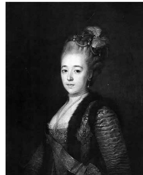
13. Жан-Луи Вуаль. Портрет великой княгини Натальи Алексеевны Около 1775. Местонахождение неизвестно

«Владимир и Рогнеда» (1770; ил. 14) чрезвычайно тщательно исследовано историками искусства последних двух столетий 27 , поэтому я остановлюсь лишь на нескольких деталях, ускользнувших от внимания и позволяющих пролить свет на степень личного внимания императрицы к созданию национального исторического жанра, а также метод поиска достоверных исторических деталей для первых исторических полотен.