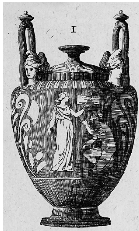
23. Лебес гамикос из собрания графа де Кейлюса. Ил. из кн.: Caylus A.C. de Tubières, comte de. Recueil d'Antiquités égyptiennes, étrusques, grecques et romaines . T. I. Paris, 1752 [76, pl. 36]