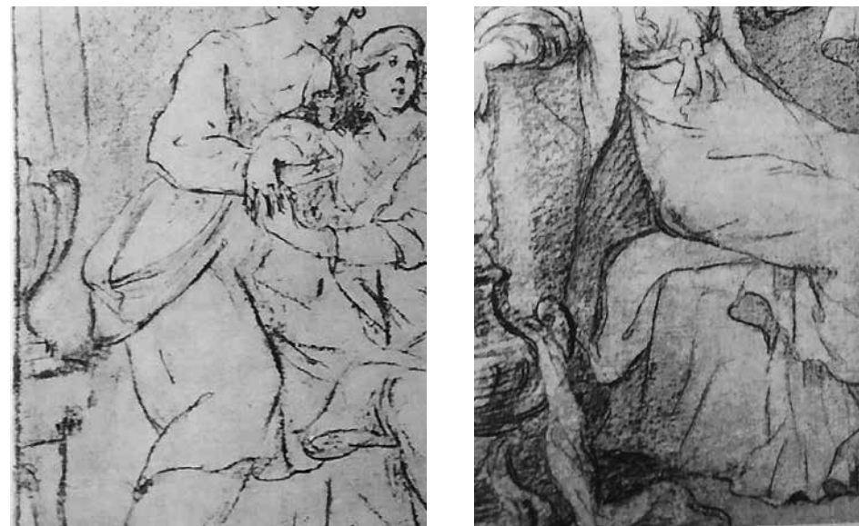
20–21. Антон Лосенко. Владимир перед Рогнедой . Эскизы. 1769 Фрагменты

Классические иконографические схемы и устойчивые формулы демонстрации аффектов, облаченные в национальные одежды и допол-