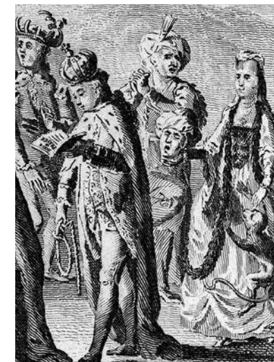
11. Неизвестный художник. Мерлин, или Картина Европы в 1773 году. Фрагмент Гравюра из журнала Westminster Magazine. 1774, January

платье “отмечает” персонально важные для Екатерины II даты: восшествие на престол и коронация, день рождения ее величества (впервые 21 апреля 1772 года) и тезоименитство (впервые 24 ноября 1772 года). С 1773 года русское платье императрицы становится атрибутом религиозных праздников, начиная с главного из них — Святой Пасхи» [5, с. 46]. Именно в таком костюме русская монархиня изображена на карикатуре из английского журнала Westminster Magazine , датированной декабрем 1773 года. (Ил. 11.) Екатерина замыкает здесь шествие европейских монархов и показана рядом с османским султаном. Она одета в славянское платье и длинную накидку с меховой оторочкой, на груди императрицы все то же жемчужное ожерелье, в руках отрубленная голова турка и обезьянка. Все это придает образу Екатерины в глазах европейского читателя восточный варварский оттенок 26 .