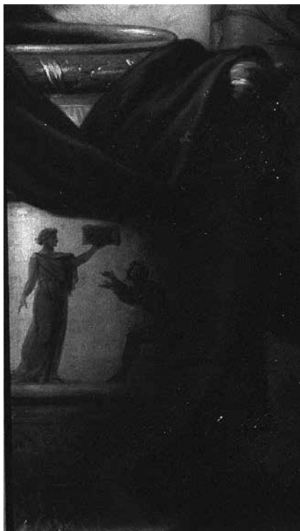
22. Антон Лосенко. Владимир перед Рогнедой . Фрагмент

до Елизаветы Петровны. Серия задумывалась как своего рода атлас к «Родословию краткого русского летописца» Ломоносова. Его иконографическим шаблоном, как и для всех портретных серий российских властителей, существующих в памятниках живописи, графики и декоративно-прикладного искусства XVIII века, стала серия инталей, вырезанных на яшме около 1723 года по заказу Якова Брюса нюрнбергским мастером Иоганном Доршем, в свою очередь опиравшимся на один из вариантов «Царского Титулярника» 1672 года [70, с. 171–174]. Помещенные в нем изображения средневековых князей, носят совершенно условный и одновременно универсальный характер. Их реаль-