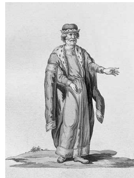
19. Иван Иванов по проекту Алексея Оленина. Князь, исполняющий при Олеге должность министра. Бумага, акварель. 27,3 × 21,7. Ил. из альбома: Choix d'anciens costumes russes d'après les Monuments les plus authentiques . Л. 8.

разумеется, не так прост, но в описи «пожитков покойного г-на Лосенко» [43, л. 80–81] упоминается зеленый портфель с эстампами, среди которых есть изображения под названием «ваз древний» 32 . Примечательно, что гравированное издание Пассери было и в библиотеке Екатерины.