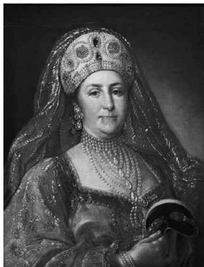
6. Неизвестный художник по оригиналу Стефано Торелли Портрет Екатерины II в русском платье . 1760-е. Холст, масло. 68 × 51. Государственный исторический музей