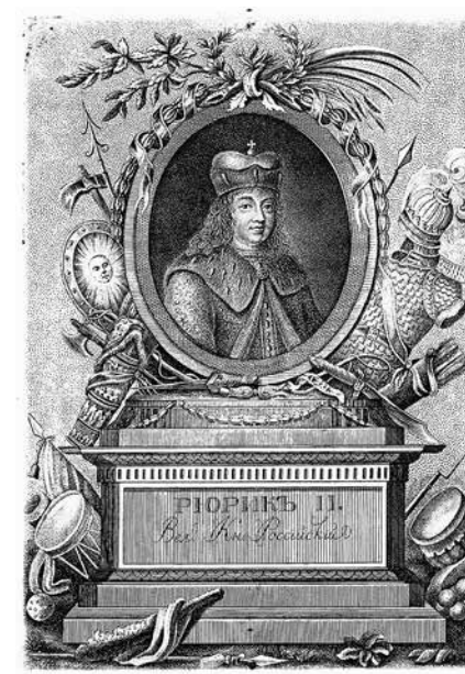
26. Неизвестный гравер. Рюрик II Гравюра из кн.: Пантеон российских государей. М., 1805. С. 153

позволяющий последовательно от пьесы к пьесе выразить авторское видение национальной истории. Для Екатерины такой концепцией, ради которой создавался весь цикл, была идея геополитической преемственности Руси по отношению к Византии.