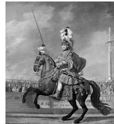
5. Вигилиус Эриксен. Портрет графа Григория Григорьевича Орлова в costume шефа римской кадрили 1766–1772. Холст, масло. 392,5 × 358 Государственный Эрмитаж

день достоверно известны два из них. Это — подробно исследованные Е. П. Ренне конные портреты шефов римской и турецкой кадрилей — графов Орловых. (Ил. 4–5.) Ренне также предполагает, что, возможно, «грубой копией с утраченного оригинала Эриксена является портрет графини Анны Петровны Шереметевой в карусельном costume работы неизвестного русского художника второй половины XVIII века» [58, с. 40].