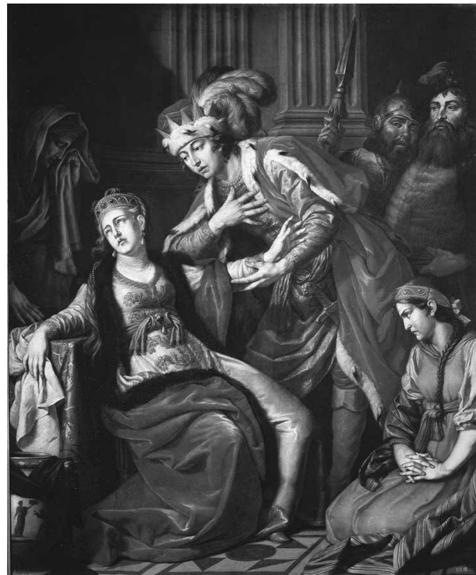
14. Антон Лосенко. Владимир перед Рогнедой . 1770. Холст, масло. 211,5 × 177,5 Государственный Русский музей

Известный архивист и историк XIX века П. Н. Петров, который «лучше, чем кто бы то ни было знал архив Академии художеств», в нескольких статьях писал о том, что в 1769 году при написании картины «Владимир перед Рогнедой» Лосенко позировал русский актер «[Иван Афанасьевич] Дмитревский, наряженный Рогнедою и убранный руками самой императрицы» [48, с. 151]. Вместе с тем существует и прямо противоположное свидетельство по этому поводу А. Н. Оленина, вступившего на пост президента Академии художеств в 1817 году, но хорошо знавшего предшествующую академическую и театральную историю. Он сообщал, что «славный тогда актер Дмитревский служил, как сказывают, в театральном своем costume моделью для Владимира» [41, с. 12]. Имея такие разноречивые высказывания, оставим вопрос об участии