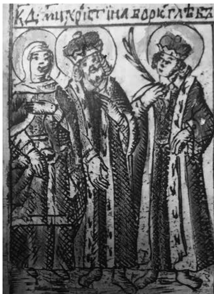
17. Св. мученики Христина, Борис и Глеб. Минеи на июль. Фрагмент. Раскрашенная гравюра. М.: Синодальная Типография, 1747. Российская Государственная библиотека

двум гравированным изображениям [76, p. 103, pl. 36; 83, pl. CXXXVI]. (Ил. 22–23.) Ручки редкой формы в виде женских голов и довольно хорошо-видимая роспись позволяют узнать его, несмотря на известную вольность художника в обращении с источником, получившим в картине куда более правильный и идеальный с неоклассической точки зрения вид. (Ил. 24.) Роспись сосуда, подробно описанная в каталоге этрусских ваз Пассери, имеет весьма подходящий к месту сюжет: юная женщина в хитоне держит в руках ларнакс — небольшой саркофаг в виде закрытого ящика с погребальной золой, в то время как другая, коленопреклоненная, протягивает к ней руки [83, pl. CXXV–CXXXVI]. Ответ на вопрос, знал ли художник изображение этрусского сосуда,