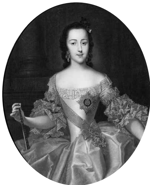
1. Георг Кристоф Гроот. Портрет великой княгини Екатерины Алексеевны 1744–1746. Холст, масло. 106,5 × 86 Государственный Эрмитаж

продолжение дел и законов Петровых, в посприии которых она также неизбежно обвинила мужа, «развратившего» все, что «Великий в свете монарх и Отец Своего Отечества Петр Великий, наш вселюбезный дед, в России установил» [34, с. 219].