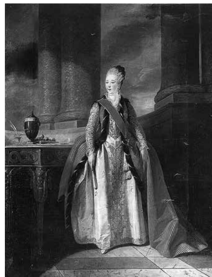
12. Пьер Этьен Фальконе Портрет великой княгини Натальи Алексеевны. 1774 Холст, масло. 261,8 × 204 Государственная Третьяковская галерея