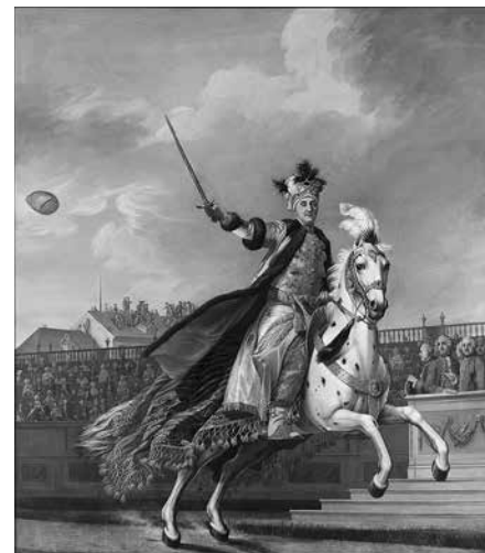
4. Вигилиус Эриксен. Портрет графа Алексея Григорьевича Орлова в costume шефа турецкой кадрили 1766–1772. Холст, масло. 398 × 356,5 Государственный Эрмитаж

Вдохновленная успехом Екатерина явно планировала увековечить память об устроенном ею турнире. В «Санктпетербургских Ведомостях» объявили, что по следам карусели будет подготовлена «особливая книга» с подробным описанием праздника и гравированными картинками, а придворному живописцу Вигилиусу Эриксену заказали цикл портретов участников в карусельных костюмах. На сегодняшний