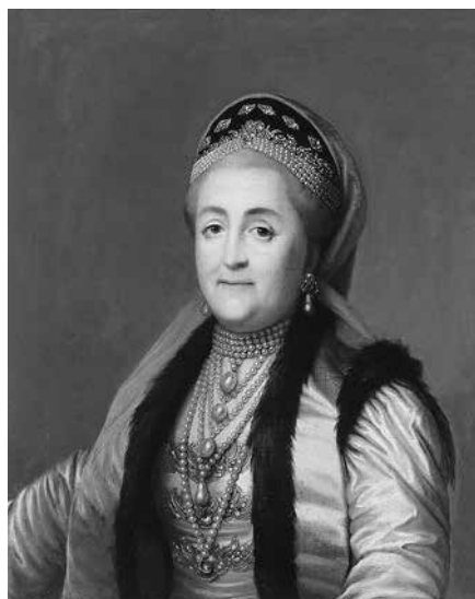
7. Неизвестный художник Портрет Екатерины II в кокошнике и шугае . Копия с оригинала Вигилиуса Эриксона (1769–1772). Середина XIX в. Холст, масло. 70 × 60. Государственный Эрмитаж