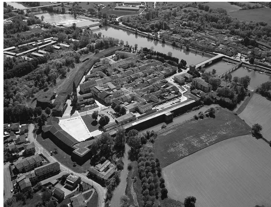
4. Пиццигеттоне (современный вид)

навигацию на реке Адде. Именно крмонцы в 1133 году начали строить на восточном берегу реки крепость. Это был небольшой форт, окруженный рвом, и деревня вокруг него, защищенная двойным деревянным частоколом с насыпью. На противоположном берегу от Пиццигеттоне находилась деревня Джера, которая сейчас является его частью. В 1333 году Пиццигеттоне оказался во власти семьи Висконти. Кирпичные стены вокруг города были возведены при Бернабо Висконти (1370) военным инженером Рафаэле Трабукко и окружены новым глубоким рвом. Ко второй половине Треченто относится и строительство замка, который был, по сути, частью западной и северной стен города. Ввиду важного стратегического положения Пиццигеттоне, замок и городские стены постоянно ремонтировались и совершенствовались — при Висконти,