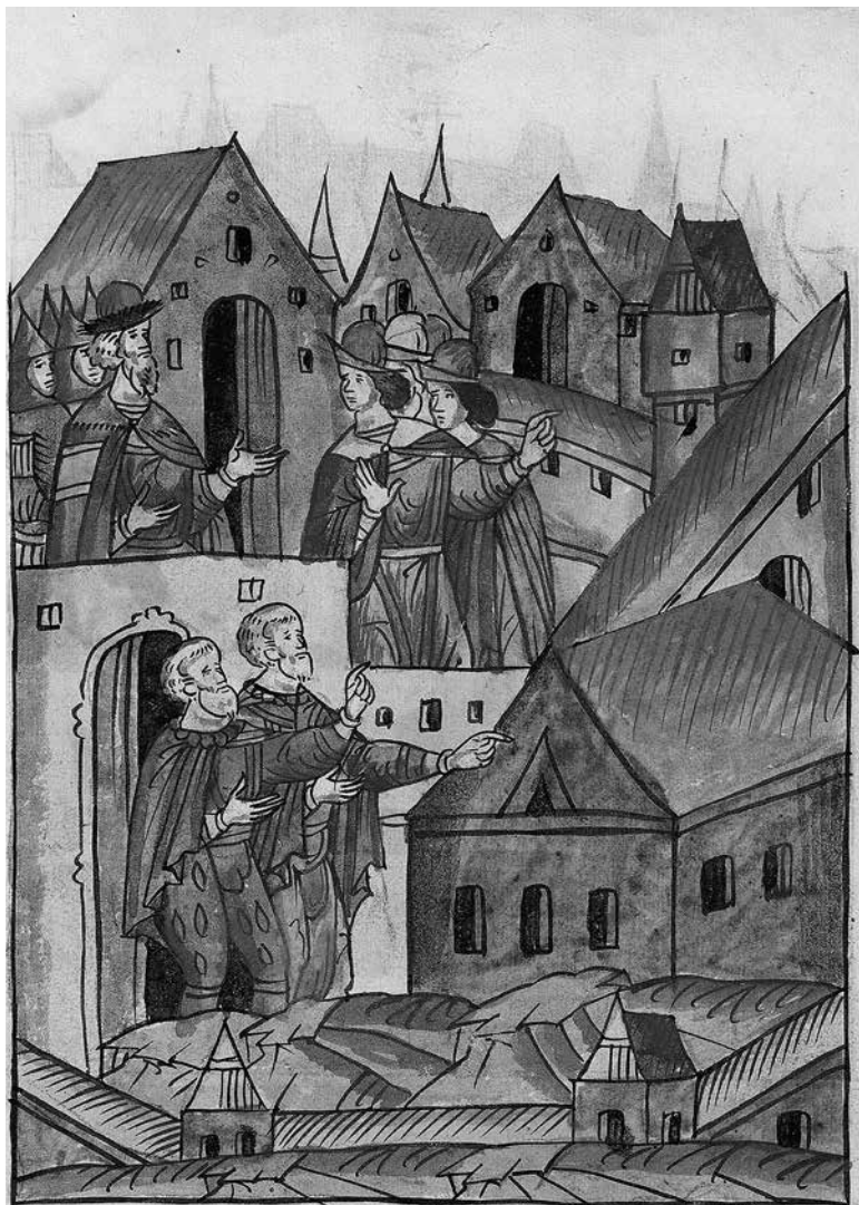
1. Пьетро Антонио Солари и Марко Руффо. Фрагмент миниатюры из Шумиловского тома Лицевого летописного свода. XVI в. Российская национальная библиотека, Санкт-Петербург. ОР F.IV.232

к итальянскому периоду творчества мастера и тем более к творчеству других представителей семьи Солари.