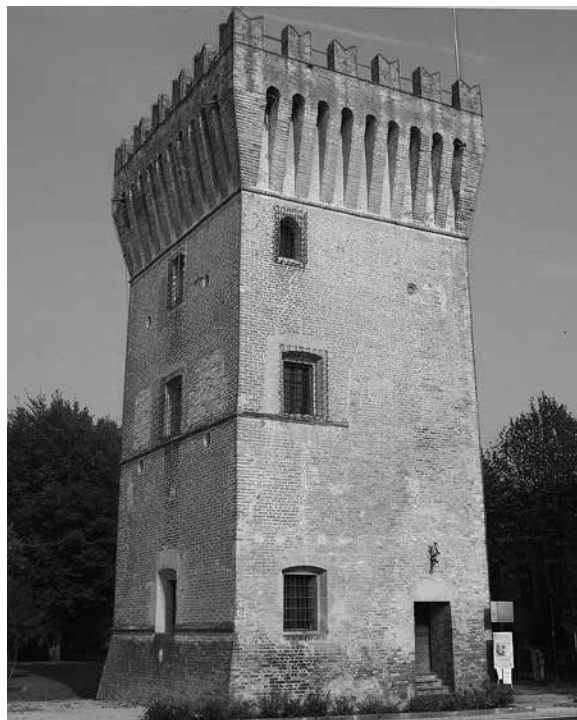
3. Торре дель Гуадо в Пиццигеттоне XIV–XV вв.

навигацию на реке Адде. Именно крмонцы в 1133 году начали строить на восточном берегу реки крепость. Это был небольшой форт, окруженный рвом, и деревня вокруг него, защищенная двойным деревянным частоколом с насыпью. На противоположном берегу от Пиццигеттоне находилась деревня Джера, которая сейчас является его частью. В 1333 году Пиццигеттоне оказался во власти семьи Висконти. Кирпичные стены вокруг города были возведены при Бернабо Висконти (1370) военным инженером Рафаэле Трабукко и окружены новым глубоким рвом. Ко второй половине Треченто относится и строительство замка, который был, по сути, частью западной и северной стен города. Ввиду важного стратегического положения Пиццигеттоне, замок и городские стены постоянно ремонтировались и совершенствовались — при Висконти,