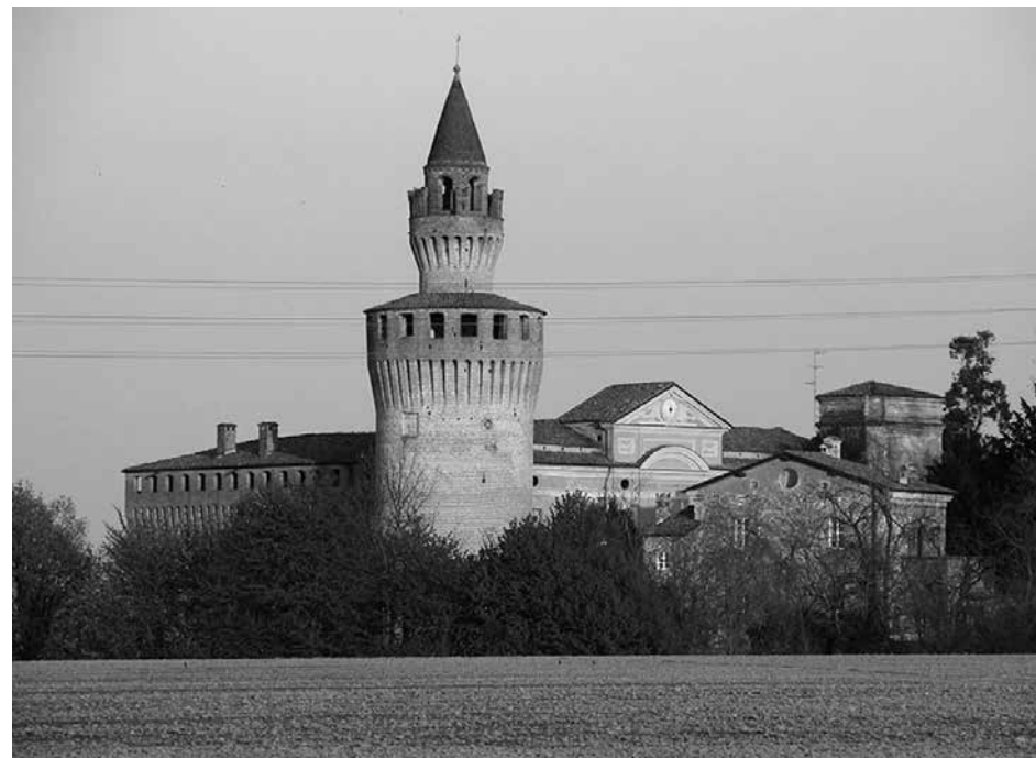
2. Замок Ривальта. XIV–XVI, XVIII–XX вв. Башня — вторая половина XV в.