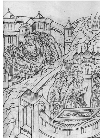
5. Того же месяца преставися царевна Анна..., а положена в Новом монастыре девичии... Фрагмент миниатюры из Царственной книги ОР ГИМ Син. № 149. Л. 346 [26, с. 431]