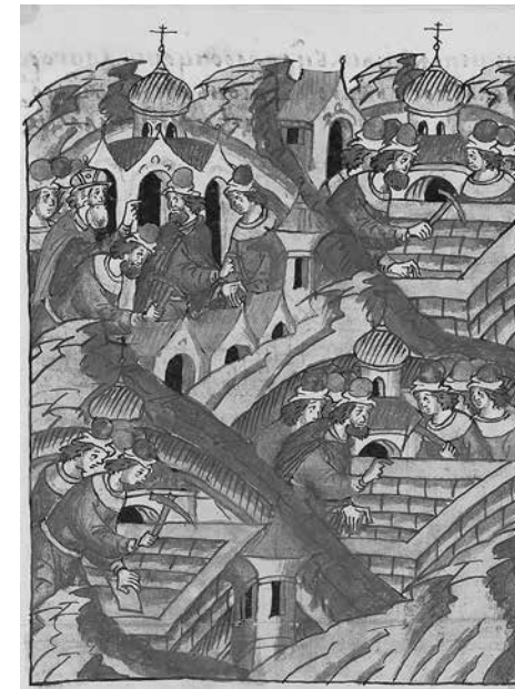
2. Заложены быша церкви каменны делати на Москве. Фрагмент миниатюры из Шумиловского тома Лицевого летописного свода. XVI в. Российская национальная библиотека, Санкт-Петербург, ОР F.IV.232. Л. 736

Эти два сообщения из разнородных источников оказались в историографии строительства в монастыре переплетенными друг с другом. На интерпретацию и их соотношение значительно повлияла запись в монастырских синодиках 1705 и 1710 годов [45; 49], датирующая обрушение собора во время строительства 1525 годом. В синодике 1705 года, исследованным и изданным в 1985 году В. Б. Павловым-Сильванским, указано поминовение: «В лето 7033-го году избивенных с храму, как строили соборную каменную церковь во святей обители сей, каменщиков 57 человек. Помяни господи: Нестора, Иоанна... Фомы» [45, с. 255–256 (Л. 58 об.)]. В поминании записано 54 человека, из них две женщины. Такая же запись существует и в Синодике редакции 1710 года.