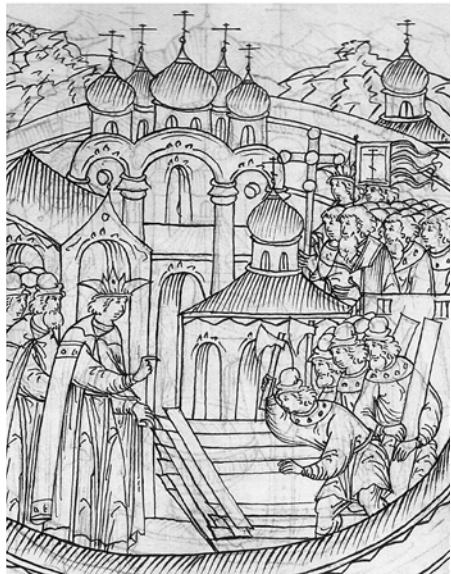
3. И приехал царь и великий князь в субботу... и обложил храм святых праведных богоотец Иоакима и Анны... Фрагмент миниатюры из Царственной книги ОР ГИМ Син. № 149. Л. 330 [26, с. 397]