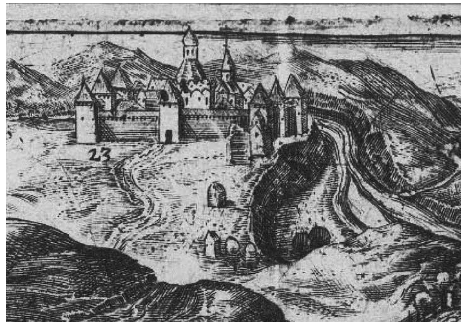
6. Томаш Маковский. Новодевичий монастырь. Фрагмент Несвижского плана. 1611 Национальный музей, Познань

Существование каменного храма, который теоретически мог сменить обыденную деревянную церковь, не означает, что его посвящение было упразднено после кончины царевны. Рассуждения о том, что после ее смерти посвящение Иоакиму и Анне перестало быть актуальным, не поддерживаются средневековой практикой. Обратимся в связи с этим к одному малоизвестному примеру строительства в связи с рождением царевны храма во имя святых богоотец Иоакима и Анны, но не в Москве, а в Великом Новгороде. Под 7058 годом в НВЛ говорится об обретенной некрополю при строительстве новой каменной дьячей избы, о чем архиепископ Феодосий направил в Москву сообщение. В ответ великий князь «велел туто быти церкви во имя Иакима и Анны, понеже в то время родися дочь Анна; а дьячью поставили на великого князя