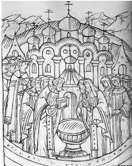
4. И дочь свою царевну Анну крестил... Фрагмент миниатюры из Царственной книги ОР ГИМ Син. № 149. Л. 330 об. [26, с. 398]