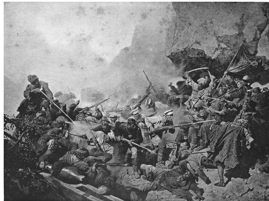
9. Теодор Горшельт. Штурм аула Гуниб 25 августа 1859 года . 1867 Ил. из кн.: Theodor Horschelt. Sein Leben und seine Werke [30, S. 10]

оговаривали детали сделки: сюжет, размер произведений, сумму заказа, а также сроки оплаты услуг художника и выполнения работы. Из письма Горшельта князю Барятинскому: «Князь Владимир Барятинский, генерал <...> заказал господину Теодору Горшельту <...> две картины маслом <...> изображающих первая — битву при Гунибе и вторая — пленение Шамиля. Главные персонажи, которых я представил, так же как местность и факты воспроизведены с максимальной точностью. Согласованная цена обеих картин — шесть тысяч рублей серебром» 17 . По договору выплата всей суммы должна была осуществиться в течение трех лет с марта 1863 года, что и было сделано, так как картины заняли место в парадных интерьерах усадьбы.