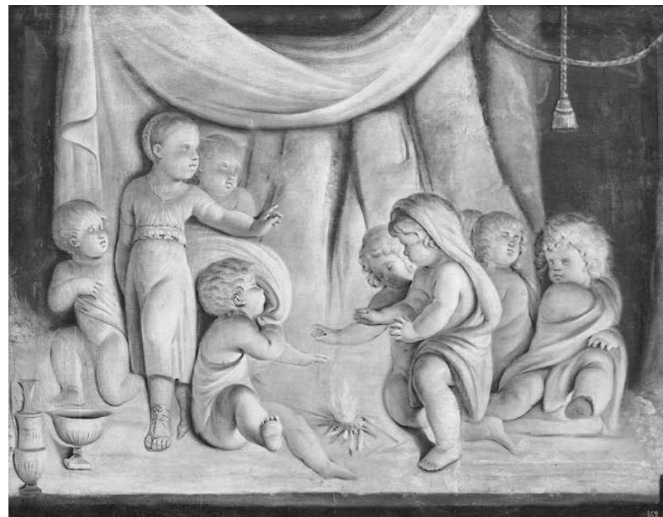
5. Антон Бруни. Амуры у костра. Аллегория зимы. 1821–1822 Холст, масло. 91 × 117,5