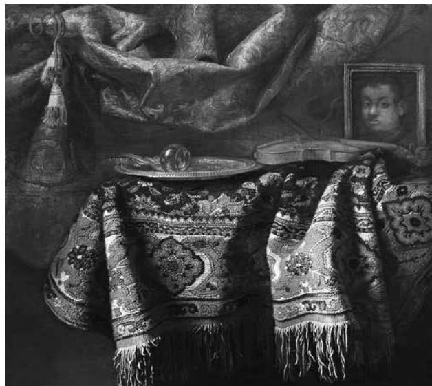
6. Франческо Нолетти Ф., прозв. Мальтезе. Натюрморт с автопортретом . Середина XVII в. Холст, масло. 115,5 × 127,5 © Курская государственная картинная галерея им. А. А. Дейнеки

экспертизы и оценки произведений, особенно в том случае, когда ящики с картинами задерживала петербургская таможня 11 . Барятинский отправлял к Виги детей крепостных для обучения 12 .