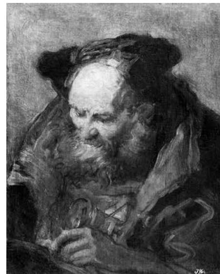
7. Джованни Баттиста Тьеполо Голова старика . Середина XVIII в. Холст, масло. 61,2 × 49,2