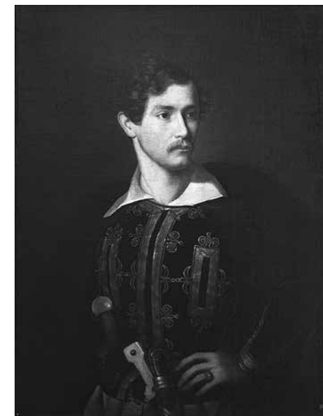
3. Луиджи Мария Сотта. Портрет фельдмаршала кн. А. И. Барятинского Конец 1830-х Холст, (дублир.), масло. 89 × 68 © Воронежский областной художественный музей им. И. Н. Крамского

и огромное наследство. П. В. Долгоруков вспоминал, что мать князя воспитала его «в таком понятии, что он поставлен рождением в какую-то, совершенно особенную степень величия <...> наравне с великими князьями <...> был от природы добр и не глуп...» [7, с. 203]. Иван Иванович был ученым-агрономом, изучал усадебное хозяйство в Англии, ценил искусства, особенное место среди его художественных увлечений занимала музыка.