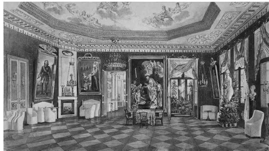
1. Николай Брезе. Гостиная в усадьбе князей Барятинских Марьино. 1871 Бумага, графитный карандаш, акварель. 17,7 × 31,8

Барятинский, и отобрал 31 портрет [21, с. 70–73]. Среди них — работы Виже-Лебрен, Лабруэ, Винтерхальтера, Вуаля, «Портрет фельдмаршала кн. А. И. Барятинского» Л. Сотта (ВОХМ им. И. Н. Крамского; ил. 3) и другие. Впервые произведения частных усадебных коллекций были представлены широкому зрителю в таком объеме, это был «уникальный свод портретов, вобравших иконографию почти 1500 лиц, жизнь и деяния которых отразили историю Российского государства с конца XVII до начала XX века» [13, с. 4].