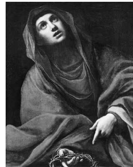
8. Алессандро Тиарини. Скорбящая Богоматерь . Первая половина XVII в. Холст, масло. 92,5 × 69

портретов служили большие картины общей гостиной, написанные «в виде камеи» Бруни [29, с. 7]. Предположительно, два из трех портретов Виги находятся в собрании Рыльского краеведческого музея как «Портрет императора Александра Первого» и «Петр Первый». Оба холста одинакового размера (300 × 200 см) и стилистически близки.