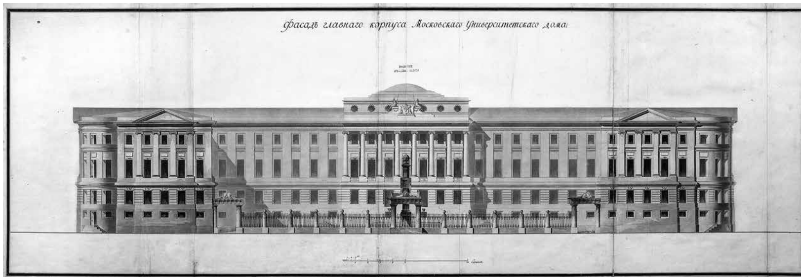
2. Матвей Казаков Москва. Московский императорский университет. Фасад по Моховой улице. 1790-е 5-й альбом Казенных строений. ГНИМА, РІ-12291/23