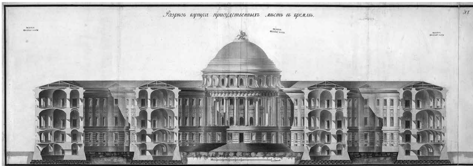
1. Матвей Казаков Москва. Кремль. Разрез здания Сената по дворам. 1790-е 2-й альбом Казенных строений. ГНИМА, РІ-12268/19