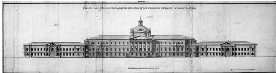
3. Матвей Казаков. Москва. Голицынская больница. Фасад по Калужской улице 1790-е. 5-й альбом Казенных строений ГНИМА, РІ-12291/36