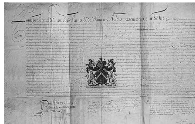
8. Грамота короля Людовика XIV Париж, 1644 Пергамент Институт истории РАН, Санкт-Петербург