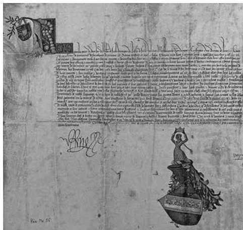
3. Грамота короля Рене Анжуйского Сен-Максимен, 1475. Пергамент Муниципальная библиотека, Экс-ан-Прованс