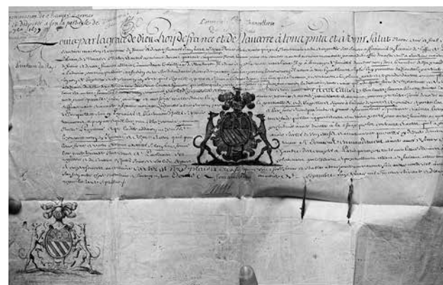
9. Грамота короля Людовика XIV Фонтенбло, 1679 Пергамент Институт истории РАН, Санкт-Петербург