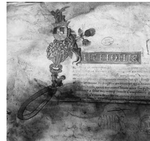
6. Грамота герцога Антуана II Доброго Левая часть. Нанси, 1517. Пергамент Национальная библиотека Франции, Париж

завиток прорастает головой птицы с длинным острым клювом, а правая изогнутая часть буквы образована двумя соединенными хвостами драконами. Но интересна эта грамота тем, что в основании вертикали буквы R впервые появляется тот самый, пока еще едва видный, стилизованный флерон, который к 1510-м годам заметно «вырос» и превратился в грамоте Антуана II Доброго в основополагающий элемент композиции.