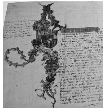
5. Грамота герцога Антуана II Доброго. Нанси, 1513. Пергамент Музей «Книга и письмо», Монкабрие