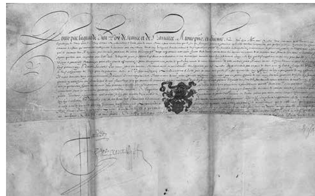
7. Грамота короля Людовика XIII Сен-Жермен-ан-Ле, 1624. Пергамент Институт истории РАН, Санкт-Петербург