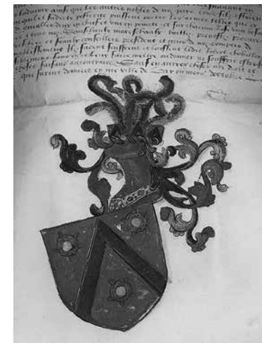
2. Грамота герцога Антуана II Доброго. Правая часть Бар-ле-Дюк, 1516. Пергамент Институт истории РАН, Санкт-Петербург

что есть в распоряжении историков искусства, изучающих позднюю миниатюру по иллюминированным документам.