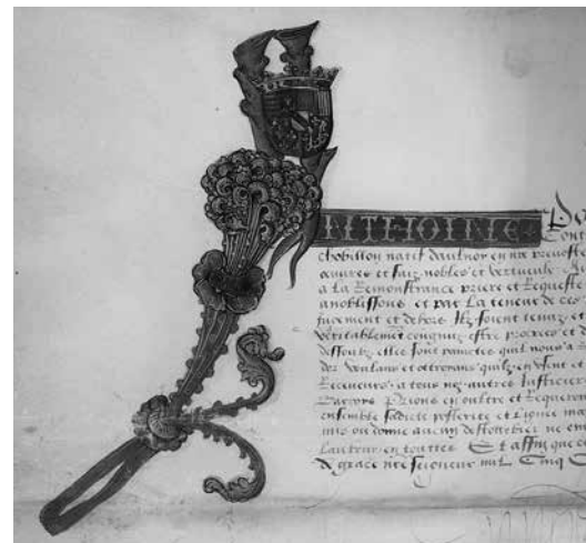
1. Грамота герцога Антуана II Доброго Левая часть. Бар-ле-Дюк, 1516 Пергамент. Институт истории РАН, Санкт-Петербург