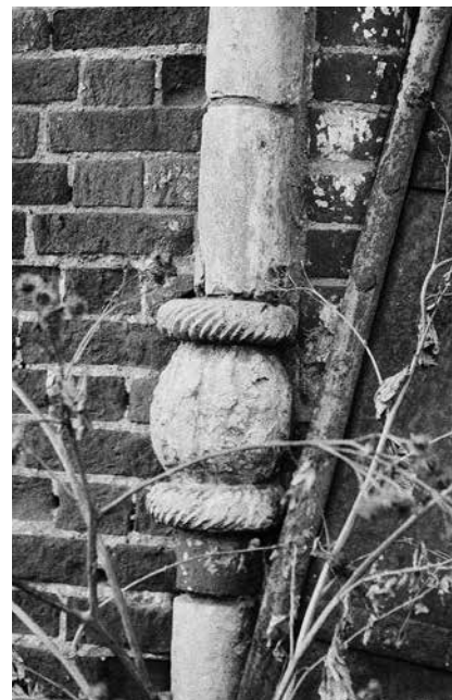
5. Церковь Благовещения Богородицы в с. Степановское Портал южного придела 1989