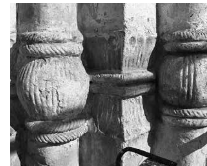
7. Собор Рождества Богородицы Медведевой пустыни Портал. Фрагмент