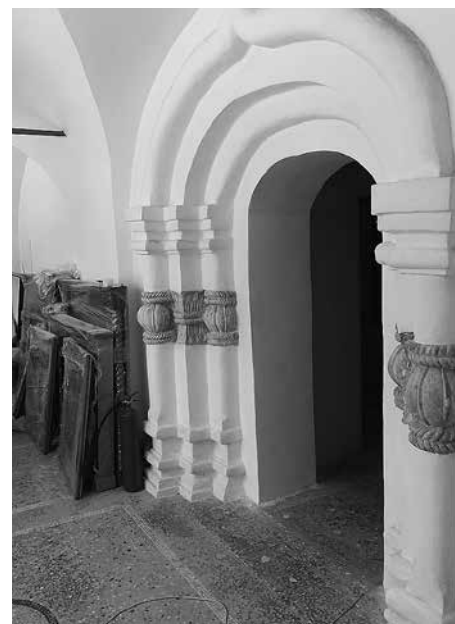
3. Собор Вознесения Господня Вознесенской Давидовой пустыни Южный портал Вид с юго-востока 2024