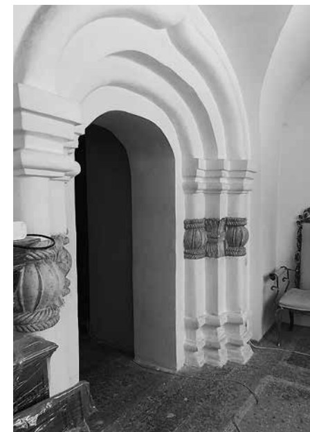
4. Собор Вознесения Господня Вознесенской Давидовой пустыни Южный портал Вид с юго-запада 2024

«Лепестки» Давидовой пустыни имеют каплевидный рисунок, практически идентичный аналогичным деталям из Медведевой пустыни (ил. 7) и Зачатьевского собора Высоцкого монастыря. При этом они имеют свои особенности — двойной контур: внутри широкого лепестка вырезан другой, имеющий узкое вытянутое основание и, напротив, подчеркнуто широкое каплевидное завершение. Аналогии можно найти и в деталях портала Антониева Краснохолмского монастыря и по рисунку и по пластической проработке. Пластика резьбы также сближает его именно со сноповидными деталями в порталах соборов Медведевой пустыни и Зачатьевского Высоцкого монастыря (кстати, обладающие и практически идентичной обработкой дыnek, разделенных на узкие валикообразные сегменты).