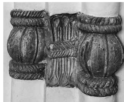
6. Собор Вознесения Господня Вознесенской Давидовой пустыни Южный портал. Белокаменные детали 2024