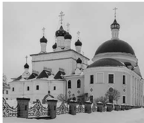
1. Собор Вознесения Господня Вознесенской Давидовой пустыни Вид с северо-востока Фото А. Слезкина. 2013