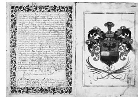
4. Джованни Альвизе Фоппа. Диплом Антонио Терци. Падуя, 1684 Пергамент. Российская Государственная библиотека, Москва, Отдел рукописей, ф. 743, карт. 7, № 28, fols. 3v–4

щей рукописи: Jo[annes]: Aloysius Foppa alme Univ[ersitatis]: ac I[n]clytae]. N[atationis]. G[ermanicae]. Script[or]. F[ecit]. M[e].