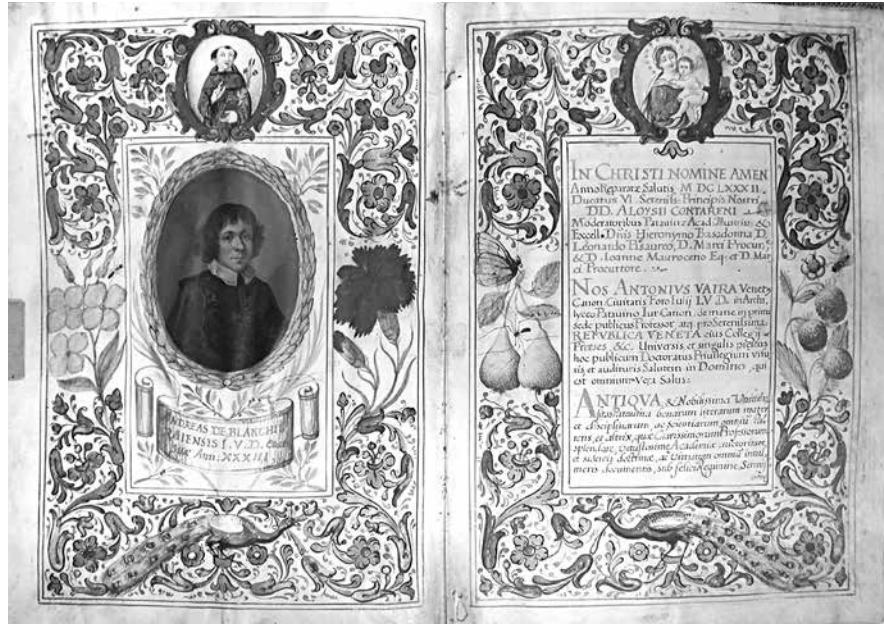
1. Джованни Альвизе Фоппа. Диплом Андреа де Бьянки. Падуя, 1682 Пергамент. Санкт-Петербургский институт истории РАН, Научный архив, ЗЕС, колл. 4, карт. 633, № 7, fols. 1v–2

Первый из трех дипломов Фоппы в наших собраниях — диплом доктора гражданского и канонического права (J. U. D. — juris utriusque doctor ) — был выдан университетом Падуи 9 июля 1682 года Андреа де Бьянки из Гориции [1, с. 221; 2, с. 395; 3, с. 402; 4, с. 228–231; 5, с. 155–157; 6, р. 166; 14, р. 14–23]. Напомним, это тот самый год, когда Фоппа стал scrittore de privilegi . Как и все дипломы этого времени, он относится к типу in codicetto (два бифолия 240 × 175 мм в бумажном переплете). Входившие в состав Collegia Doctorum и упомянутые в начале текста Антонио Вайра, Ян Муникауза, а также секретарь Себастьяно Моретти поставили свои подписи под документом. На последней странице в самом низу (fol. 3v), между двумя красными линиями обрамления мелкими, едва заметными буквами написано: Jo[annes] Aloysius Foppa alme Universit[at]is: ac I[n]clytae. N[at]ionis. G[ermanicae]. Scriptor. F[ecit].