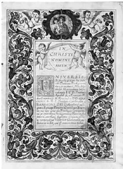
5. Джованни Альвизе Фоппа Диплом Роберто Кузано Падуя, 1688 Пергамент. Государственный Исторический музей, Москва, Отдел письменных источников, колл. 418, ед. хр. 526, fol. 1