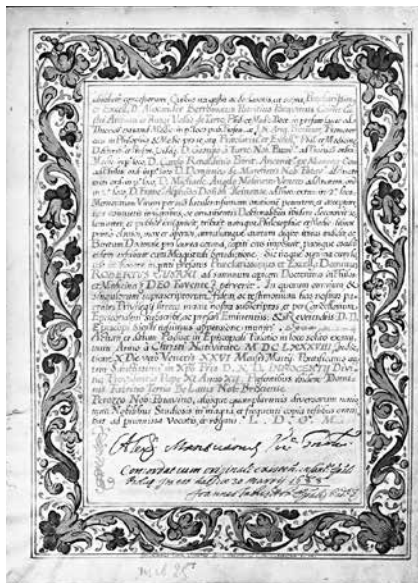
6. Джованни Альвизе Фоппа Диплом Роберто Кузано. Падуя, 1688 Пергамент. Государственный Исторический музей, Москва, Отдел письменных источников, колл. 418, ед. хр. 526, fol. 2v

Падуи 26 марта 1688 года Роберто Кузано из Вероны [8, p. 77–78; 14, pp. 14–23]. (Ил. 5.) Он также относится к типу «in codicetto» (сохранился лишь один его бифолий 240 × 175 мм). Подписан диплом уже знакомым нам по предыдущему документу входившим в состав Collegia Doctorum генеральным викарием Алессандро Мантовани и секретарем Джованни Фаббри (?). Подпись Джованни Альвизе Фоппа находится также в самом низу последней страницы (fol. 2v) между двумя красными линиями оформления и выглядит так: Jo[annes]: Aloysius Foppa Venetus alme univer[sitatis]. ac I[n]clytae. N[at]ionis. G[er]manicae. Scriptor F[ecit]. M[e]. (Ил. 6.) Она отличается от двух предыдущих тем, что здесь Фоппа называет себя венецианцем.