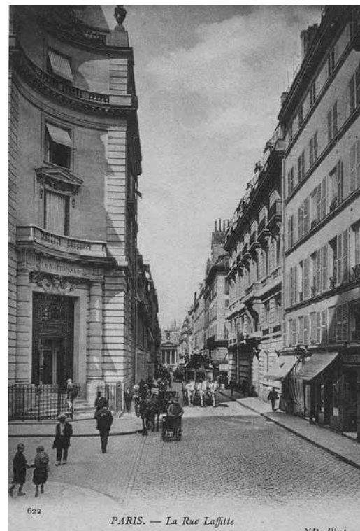
2. Улица Лаффит, Париж. 1890-е Почтовая открытка

Лаффит (ил. 2) уже несколько лет сменяли друг друга в качестве визитеров и клиентов молодые коллекционеры из Германии, Швейцарии, Скандинавии, Британии и Соединенных Штатов. Покровитель импрессионистов пожинал плоды своего почти тридцатилетнего труда по их поддержке и популяризации, тщательного выстраивания имиджа художников-новаторов и собственного образа не как дельца, но как увлеченного дилера-просветителя 1 . Прежде рискованные и убыточные, его сделки оказались выгодными и престижными, а скромная галерея превратилась в крупное предприятие с заокеанским филиалом,