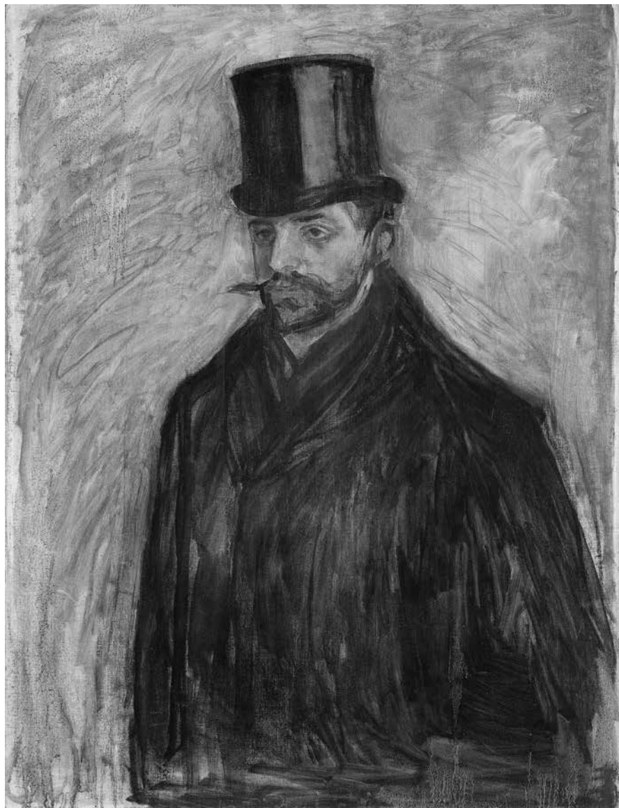
9. Эдвард Мунк. Портрет Ю. Мейер-Грефе. 1894. Холст, масло. 100 × 75 Национальный музей, Осло

изучения истории современного искусства такими критиками и учеными, как Теодор Дюре и Камиль Моклер во Франции, Рихард Мутер, Юлиус Мейер-Грефе и Отто Граутофф в Германии или (несколько позже) Роджер Фрай в Британии. Верно это и в случае Щукина: помимо близости с писавшим в российской прессе братом Иваном решающее воздействие оказали на него тексты о современном искусстве Александра Бенуа, предопределив, к слову, и ранний интерес коллекционера к символизму. Однако вскоре отечественные историки искусства, даже столь влиятельные, как Павел Муратов, были вынуждены «идти в фарватере» находок темпераментного Щукина. Интересно, что в середине 1900-х коллекционер отвел центральный зал своего особняка полотнам Сезанна, словно подчеркивая ту основополагающую роль, что отдали ему искусствоведы, однако уже в 1911 году заменил работы Мастера из Экса на картины Матисса (делая развеску вместе с самим художником), в свою очередь дав стимул современной художественной критике. Такое живое, активное взаимовлияние «новых коллекционеров» и «новых критиков» было одной из ключевых характеристик художественной ситуации «около 1900 года» в целом 5 .