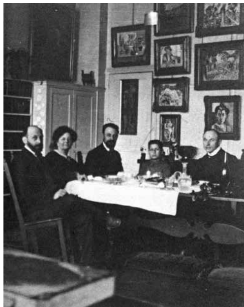
7. Анри Матисс в апартаментах Стайнов на Рю де Флёрюс в Париже. Середина 1900-х. Крайний слева — Лео Стайн

как влиятельный центр концентрации знания (от особенностей стиля до адресов художников) о современном искусстве и его презентации с помощью новаторских средств — масштабных и изобретательных выставок (от ретроспектив до презентации последних работ мастеров), многочисленных публикаций (от фундаментальных трудов до журнальных статей), рассчитанной рыночной тактики. Представители «второго поколения» собирателей, как правило, прибегали к посредничеству арт-дилеров — от «старых» и статусных, как Дюран-Рюэль, до более молодых, вступивших в среду парижского художественного рынка в конце XIX — начале XX века, — братьев Жосса и Гастона Бернхеймов, Эжена Дрюэ и, конечно, Амбруаза Воллара.