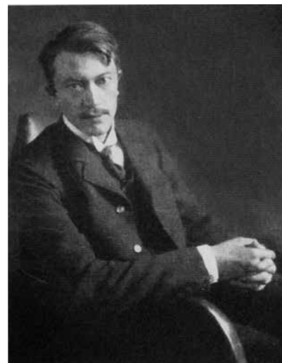
10. Карл-Эрнст Остхаус. 1910-е