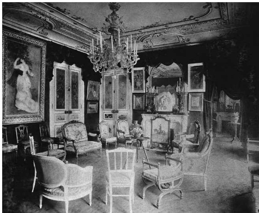
3. Апартаменты П. Дюран-Рюэля на Рю де Ром в Париже. 1890-е

Действительно, ровесники самого Дюран-Рюэля, старшие современники мастеров «нового искусства» и их первые покровители постепенно покидали круг активных коллекционеров, а их собрания одно за другим распродавались, формируя новые границы и архитектуру рынка современного искусства, безальтернативным центром которого стал Париж. В 1890-е годы навсегда потеряли единство эпические по истории сложения и масштабу коллекции Эммануэля Шабрие и Жана-Батиста Фора, графа Армана Дориа и Эжена Мюрера, Жоржа де Беллио и Виктора Шоке, не говоря о десятках менее крупных личных собраний. Насчитывавшие порой не один десяток полотен Мане, Моне или Писсарро (как у Ж.-Б. Фора), складывавшиеся во многом благодаря дружеским связям внутри парижской артистической среды 1870–1880-х годов, коллекции этого первого поколения любителей и собирателей