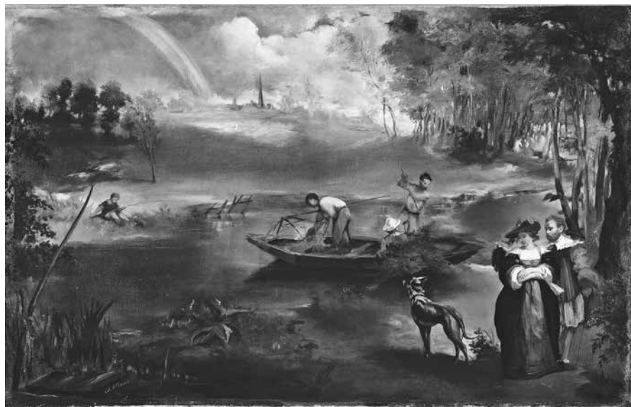
1. Эдуар Мане. Рыбная ловля Около 1862–1863 Холст, масло. 76,8 × 123,2 Музей Метрополитен, Нью-Йорк