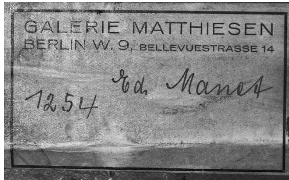
5. Этикетка галереи Matthiesen на подрамнике копии картины Рыбная ловля ГМИИ им. А. С. Пушкина

Что же произошло с картиной дальше и как она оказалась в Москве в числе перемещенных ценностей? О бытовании картины в 1927–1945 годах свидетельств пока не обнаружено, но версию ответа здесь может предложить наклеенный на подрамник ярлык берлинской галереи «Маттисен» с недвусмысленной надписью «Эдуар Мане». (Ил. 6.) Именно в этой галерее в 1928 году состоялась первая монографическая выставка произведений Мане, общепризнанная в научном сообществе и по сей день. В ней принимала участие подлинная «Рыбная ловля» — та, что хранится сейчас в Метрополитен, и ясно, что по своей воле ярлык с такой надписью на очевидную и известную копию здесь никто бы не поместил! Несомненно, о добровольности речь уже и не шла: в 1935 году галерея «Маттисен», как за-