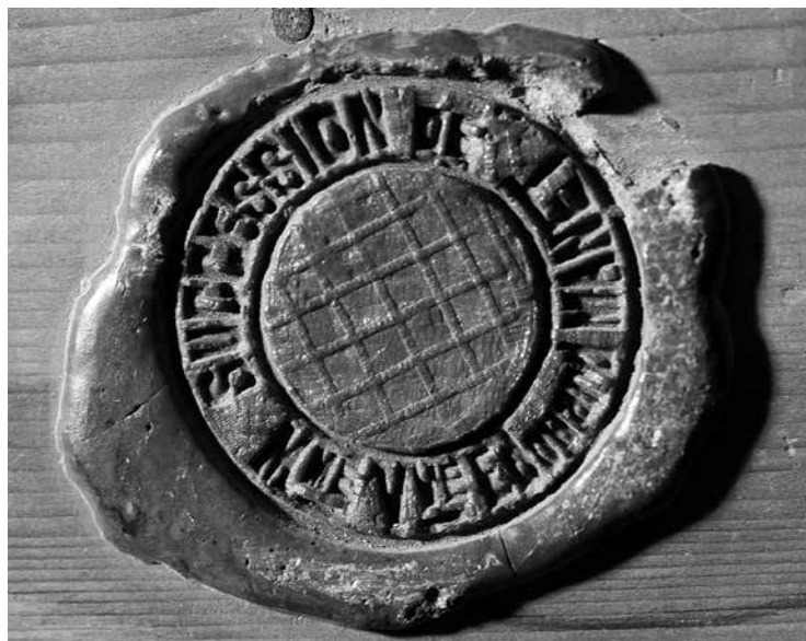
4. Печать Наследие вдовы Эдуара Мане на подрамнике копии картины Рыбная ловля ГМИИ им. А. С. Пушкина